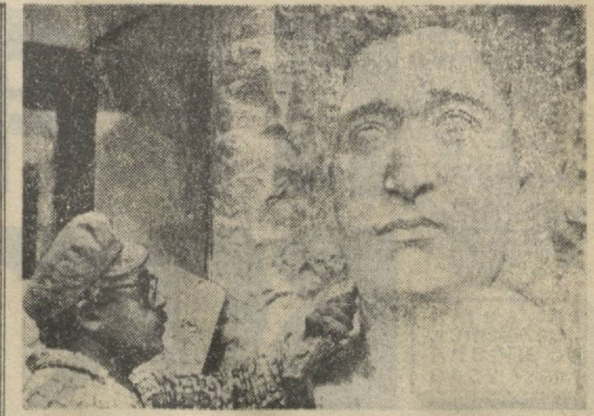
Идя навстречу XXVI съезду КПСС, строители Табашенского метрополитена досрочно, на четыре с половиной месяца раньше срока, сдали в эксплуатацию второй участок первой линии метро. Вступили в строй еще три станции — «Хамид Алимджан», «Пушкинская» и «Максима Горького».