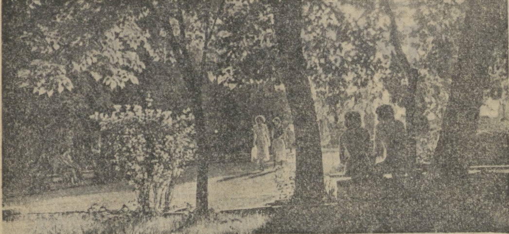
Ташкент. Вечером в сквере на улице Ленина.