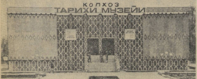
Более пяти тысяч колхозников, учащихся школ, представителей интеллигенции из различных районов области посетили исторический музей колхоза «Москва» Кировского района Фогранской области...