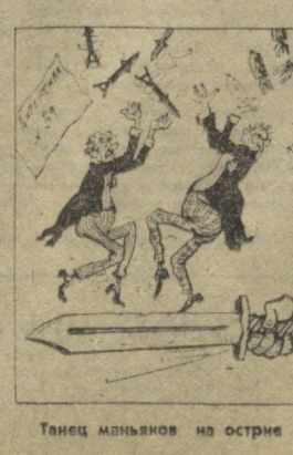
Танец мянчан на острие меча Марса... Рис. Б. ЖУКОВА.

Новая ядерная стратегия НАТО в директиве № 59, представляющей серьезную опасность для всего человечества. (Из газет).