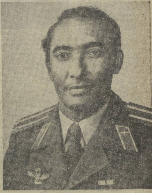
Космонавт-исследователь корабля «Союз-38», гражданин Республики Куба Арнальдо Тамayo Мендес.

международных экипажей совместно с советскими космонавтами провели исследования в космическом пространстве представители шести социалистических стран. Полет седьмого международного экипажа в составе советского и кубинского космонавтов является новым свидетельством дружбы народов Советского Союза и Кубы, тесного взаимодействия обеих братских стран.