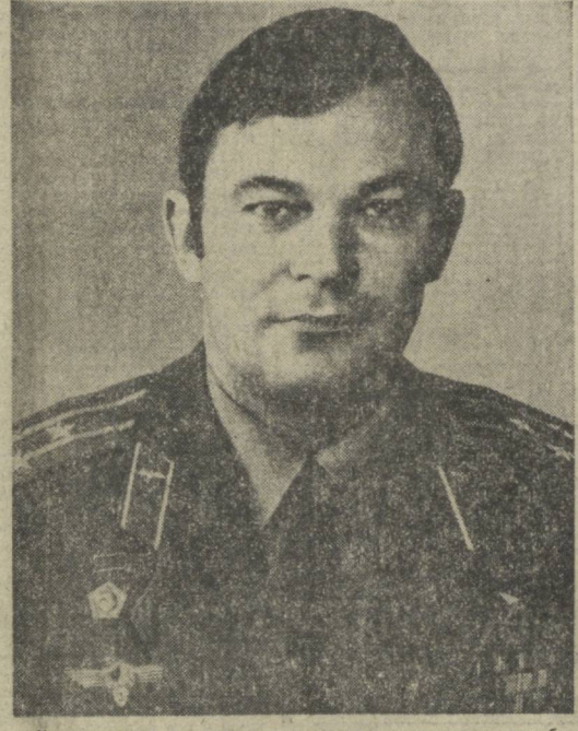
Командир международного экипажа космического корабля «Союз-38», Герой Советского Союза, летчик-космонавт СССР Юрий Викторович Романенко.

18 сентября 1980 года в 22 часа 11 минут московского времени в Советском Союзе осуществлен запуск космического корабля «Союз-38».