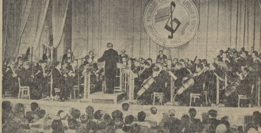
На снимке: в концертном зале «Бахор» с успехом выступает Большой симфонический оркестр Центрального телевидения и Всесоюзного радио. Художественный руководитель и главный дирижер — народный артист РСФСР, лауреат Государственной премии имени М. И. Глинки Владимир Федосеев.

ОБ ЭТОМ КРАСНОРЕЧИВО СВИДЕТЕЛЬСТВУЕТ ШЕСТВУЮЩИЙ ПО РЕСПУБЛИКЕ ПРАЗДНИК