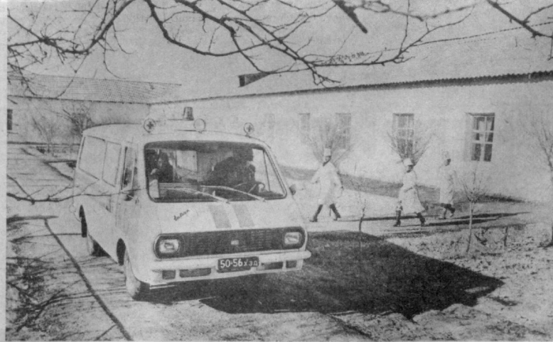
Для земледельцев колхоза «Коммуна» Багатского района открылась новая больница, рассчитанная на 100 коек. Она построена по наказу избирателей. Здесь работают хирургическое, терапевтическое, неврологическое, родильное, физиотерапевтическое отделения. Больных обследуют квалифицированные врачи и медработники. Помимо стационара, в сельской больнице 150 человек могут ежедневно получать амбулаторное лечение. На снимке: в «Спирной помощи» новой больницы.