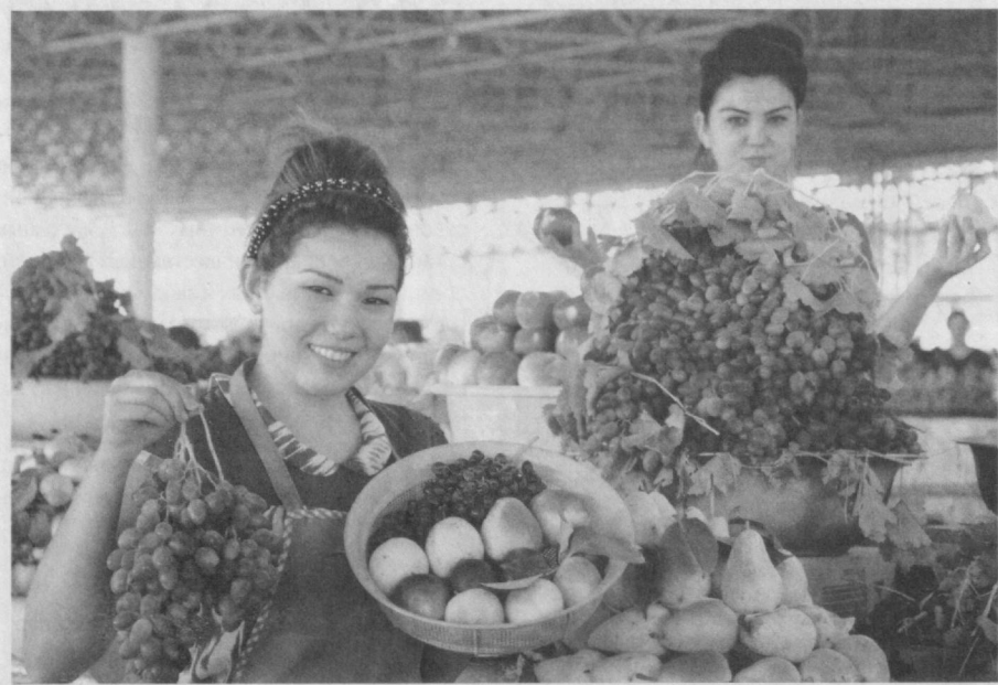
■ При Ургенчском дехканском рынке начала действовать торговая ярмарка по продаже сельскохозяйственной продукции. Земледельцы и садоводы области поставляют ее к столу горожан по доступным ценам.

Фермеры продают фрукты и овощи, мясную продукцию. Особое внимание уделяется стабилизации цен и расширению продаж по пластиковым карточкам.