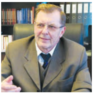
Михаил ПОПКОВС, Латвиянинг Ўзбекистондаги Фавқулодда ва мухтор элчиси:

Россия Федерацияси Инсон ҳуқуқлари бўйича кенгаши БМТ тизимидаги асосий орган, деб ҳисоблайди. Умид қиламизки, Ўзбекистон ва бошқа ҳамкор мамлакатлар билан биргаликдаги саъй-ҳаракатлар орқали Кенгашни бутун дунё бўйлаб инсон ҳуқуқларини рағбатлантириш ва ҳимоя қилишнинг самарали воситасига айлантириш мумкин. Унинг фаолияти универсаллик, танланмаслик, холис-лик, инсон ҳуқуқларининг барча тоифаларига тенг муносабат, маданий ва цивилизация хилма-хилликка ва ўзаро ҳурмат тамойилларига асосланади.