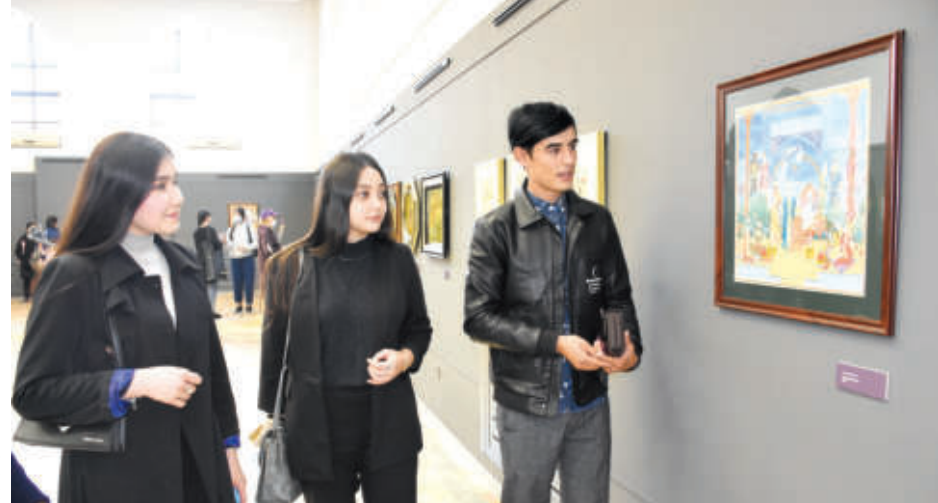
Ўзбекистон Республикаси Президентининг 14-16 октябрь кўнлари мусаввир ижодида бағишланган халққаро симпозиум ўз ишини бошлади. Тошкент фотосуратлари уйда очилиш маросими ўтказилди ҳамда “Эй мусаввир, дилбаримга сурате монанд қил...” мавзудаги миниатюра ва хатотлик асарларининг юздан зиёд намунаси санъат илҳомчилари эътиборига ҳавола этилди.

Ўз даврининг буюқ мусаввири Камолитдин Беҳзод XV асрнинг иккинчи ярмида Хирот миниатюра мактаби асосчиси сифатида шухрат қозонган. Беҳзод ижодидаги ҳаётини мавзулар ва уларнинг муҳирона талқини расом асарларини жаҳон санъати ноёб дурдоналари сифатида жуда катта маънавий қиймат ва аҳамиятга эгаллигини кўрсатади.