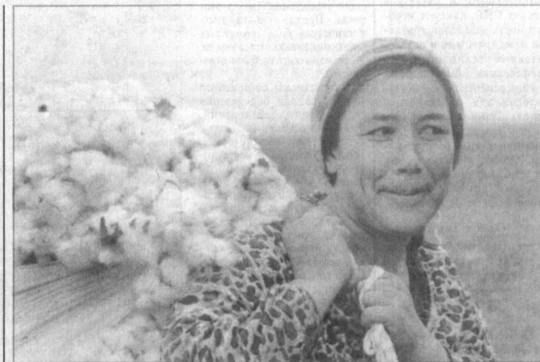
В хозяйстве Янги-Арик под хлопчатником занято 800 гектаров. Из них 425 засеяны семенами тонковолокнистого хлопка сорта «термез-31». В нынешнем году земледельцы обязались получить с каждого гектара по 31,1 центнера хлопка-сырца и сдать государству 1377 тонн. Урожай на полях выращен богатый. В эти дни, используя каждый погожий день, на полях трудятся две тысячи сборщиков.

встречаются и в других районах, граничащих с соседними государствами. Горько сознавать, что некоторые граждане ради наживы забывают об интересах своей Родины. Принимаются строгие меры для того, чтобы предотвратить подобные случаи.