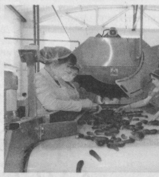
ванных современной техникой и технологиями.

Агробанк оказывает финансовую поддержку не только предпринимателям, работающим в сфере аграрного сектора, но и промышленности, людям, занятым в семейном бизнесе, начинающим свое дело молодым людям.