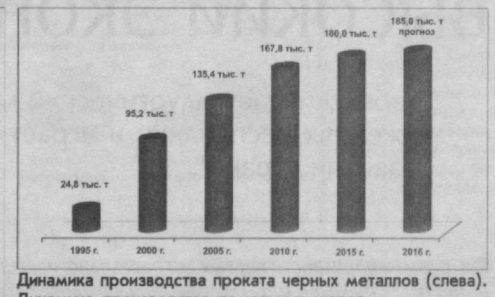
Динамика производства проката черных металлов (слева). Динамика производства помольных шаров.