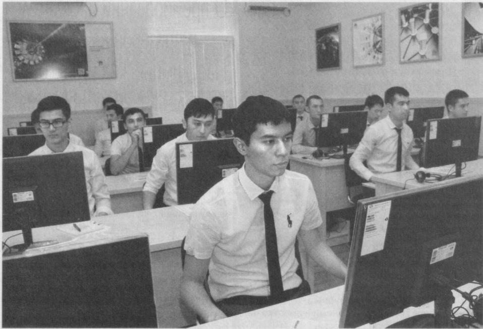
В рамках Недели информационно-коммуникационных технологий ICTWEEK 2016 компания "Huawei" запустила первую в Центральной Азии Авторизованную академию информационных и сетевых технологий по проекту HAINA.

Проект будет функционировать в Ташкентском университете информационных технологий и призван стать базой для дальнейшей подготовки высококвалифицированных специалистов сферы ИКТ и телекоммуникаций Узбекистана. Он уникален тем, что при ТУИТ будет создан специализированный Центр сертификации кадров в сфере информационно-коммуникационных технологий.