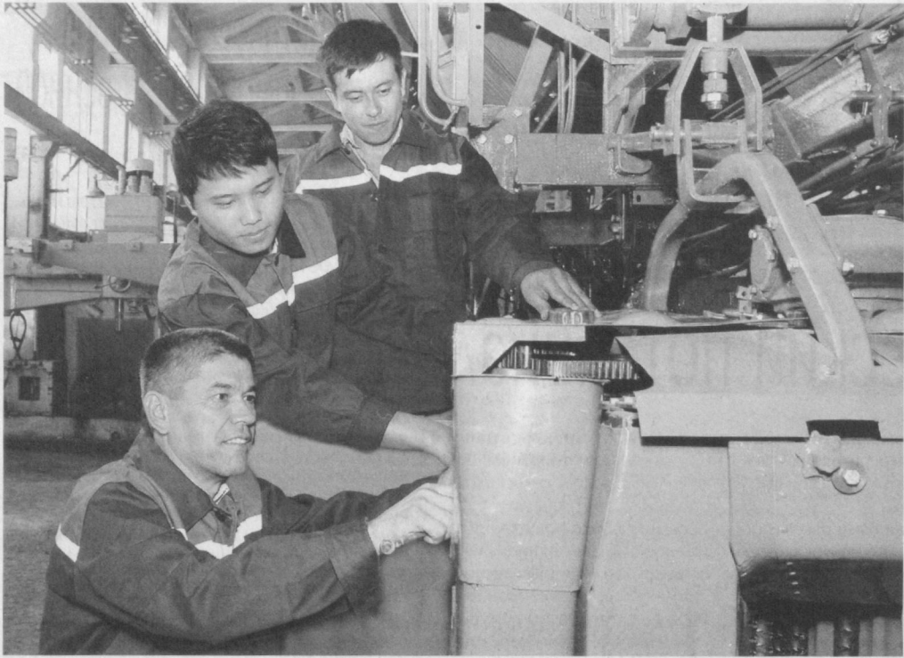
Созданием и внедрением передовых научно-технических разработок, применяемых главным образом в аграрном секторе, уже много лет успешно занимается столичное АО "Технолог".

В цехах предприятия ведутся работы по конструированию и производству технологической оснастки для тракторов и комбайнов, производственных автоматизированных линий, нестандартного оборудования, запчастей для отечественной и зарубежной техники, а также разнообразной импортозамещающей продукции для ХК "Узгросаноатмашхолдинг", АК "Узбекэнерго" и других организаций.