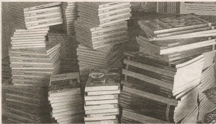
5-синф «Адабиёт» дарслигига кири-