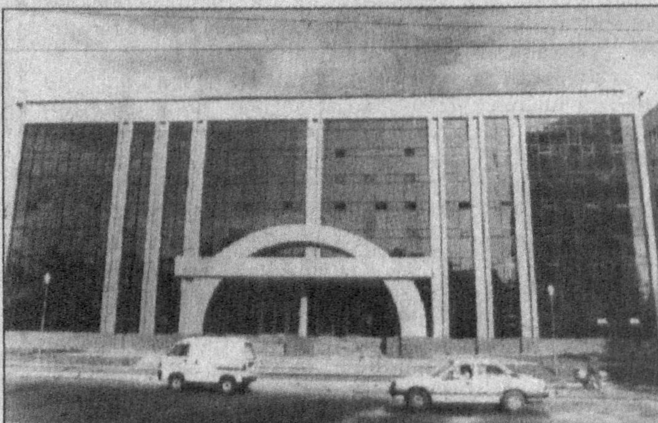
Метронинг "Минор" бекати

Дунёда метроси бор шарҳлар кўп. Лекин уларнинг ичида энг зўри Токент метроси. Чунки у бизнинг метромиз. Узиники барибир яхши-да.