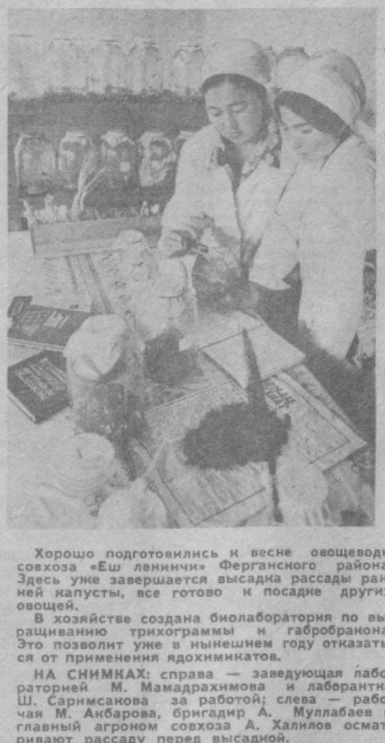
Хорошо подготовились к весне овощеводы совхоза «Еш Ленинчи» Ферганского района. Здесь уже завершается высадка рассады ранней капусты, все готово и последние дни других овощей.