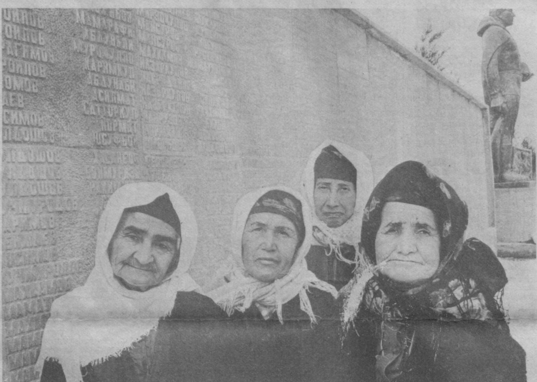
СОЛДАТСКИЕ ВДОВЫ Жительницы союза «Аванст» Хавастского района Ульяновской области на мемориале в память погибшим воинам.