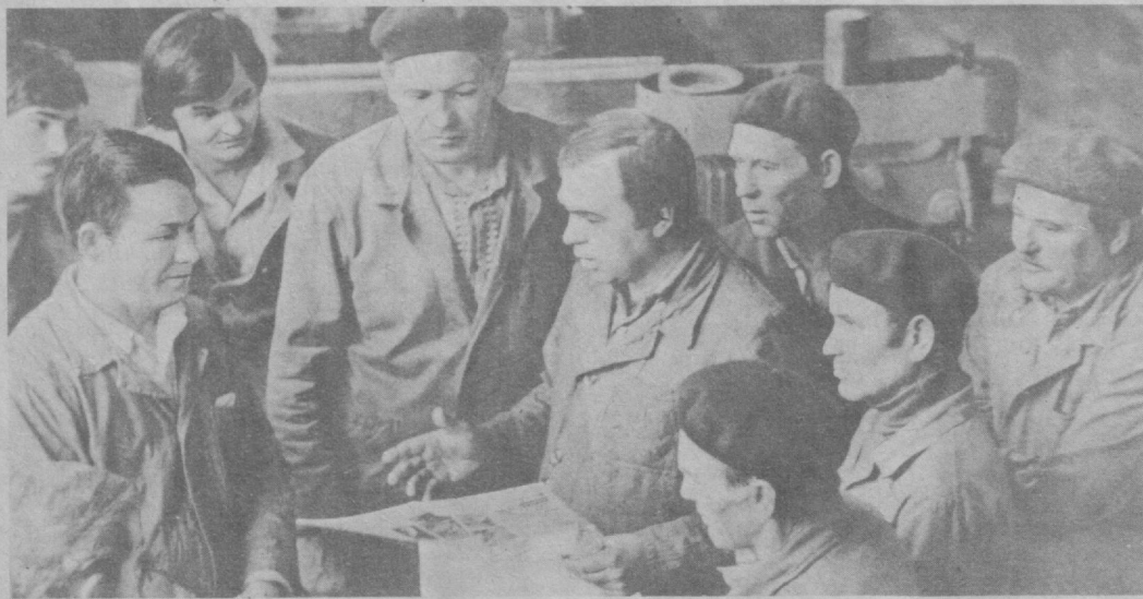
Не уходите от открытого разговора с людьми, уметь разъяснить политику партии, учить массы, но и «уметь учиться у масс, что называется, заглядывать на массу» — именно этим принципом руководствуется в своей деятельности партийный комитет научно-производственного объединения «Технолог», уделяя самое серьезное внимание совершенствованию форм и методов проведения встреч с трудящимися. Особенно эффективно проходят деловые встречи в трудовом коллективе опытно-механического завода имени Ильича. На политденях здесь всегда многолюдно. Рабочие, служащие сами

80-летию ПЕРВОЙ НАРОДНОЙ РЕВОЛЮЦИИ В РОССИИ БЫЛ ПОСВЯЩЕН ПРОВЕДЕННЫЙ В РЕСПУБЛИКЕ 22 МАРТА ЕДИНЫЙ ПОЛИТДЕНЬ