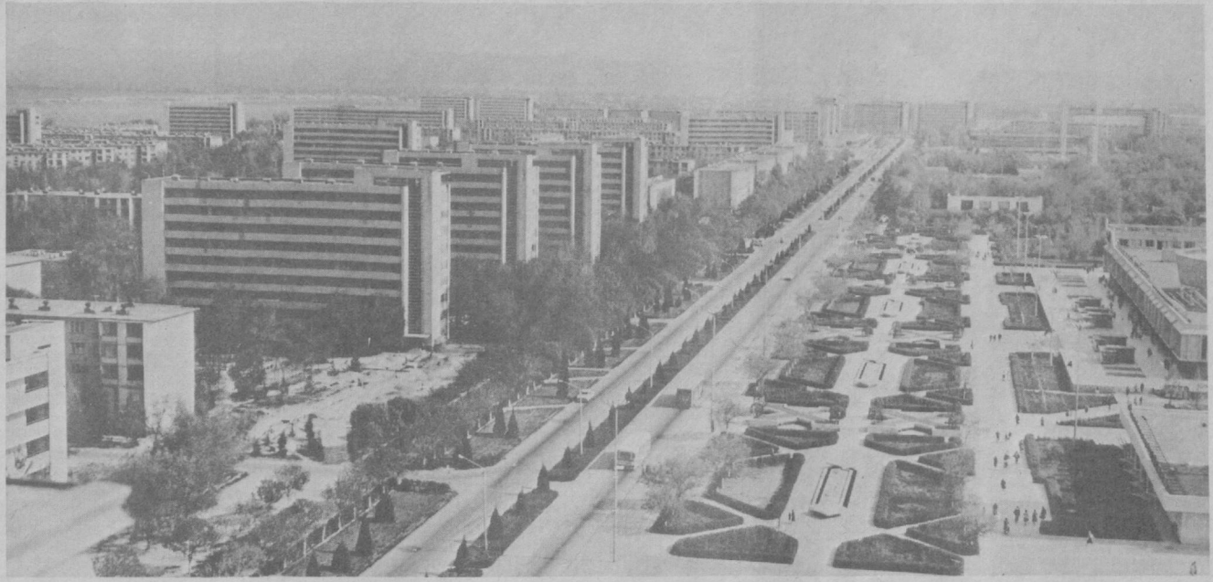
Панорама центра города Навои.

Современная узбекская архитектура сформировалась как составная часть всей советской архитектуры. Ее корни — исторический опыт и традиции местного зодчества.