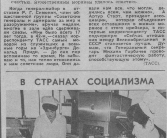
В КНР создается экономический район, включающий Шанхай и окружающие его провинции. Как утверждал агентств Синхуа, район займет важное место в валовом производстве промышленной и сельскохозяйственной продукции страны, в объеме поставок товаров на рынках и в сумме валютных поступлений из экспорта. Городские власти получили широкое полномочия заключать соглашения с зарубежными фирмами о создании предприятий с участием иностранного капитала. Уже возникло более 220 смешанных предприятий. В одном из шанхайских предприятий со смешанным капиталом.