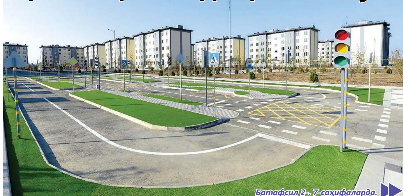
Батафсил 2-, 7-саҳифаларда.

Мегаполис шаҳарлар учун транспорт коммуникация тизимини ривожлантириш орқали аҳоли ва ҳаракатланаётган автомобилларга қулайлик яратиш муҳим аҳамиятга эга. Марказий Осиёнинг энг йирик шаҳри – Тошкентда ҳам кўплаб аҳоли турар жойлари ҳамда транспорт инфраструктурасини ривожлантириб, янги лойиҳаларни ҳаётга татиқ этишга катта аҳамият қаратилмоқда.