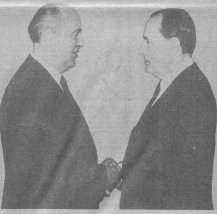
Перед началом встречи.

М. С. Горбачев, согласившись с выводами Ф. Миттерана, отметил, что сейчас