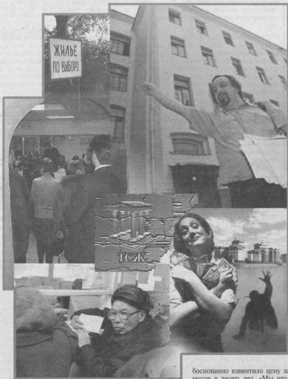
боснованно взвинтило цену за мусор в десять раз. «Мы что, больше сорить стали?» - резонно возражают хозяева квартир.

Обратимся теперь непосредственно к деньгам, оговорив с самого начала следующее. Никто не спорит против того, что собственник имущества обязан содержать