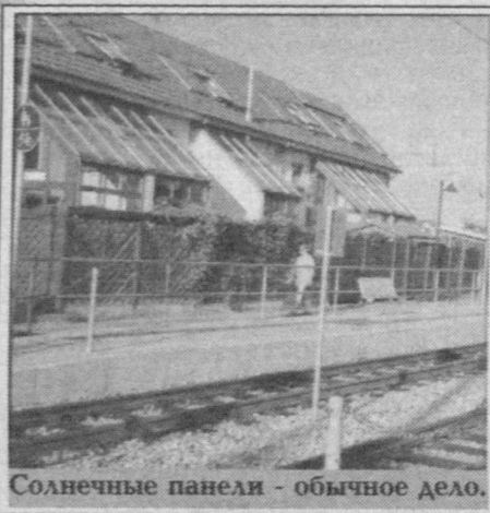
Солнечные панели - обычное дело.