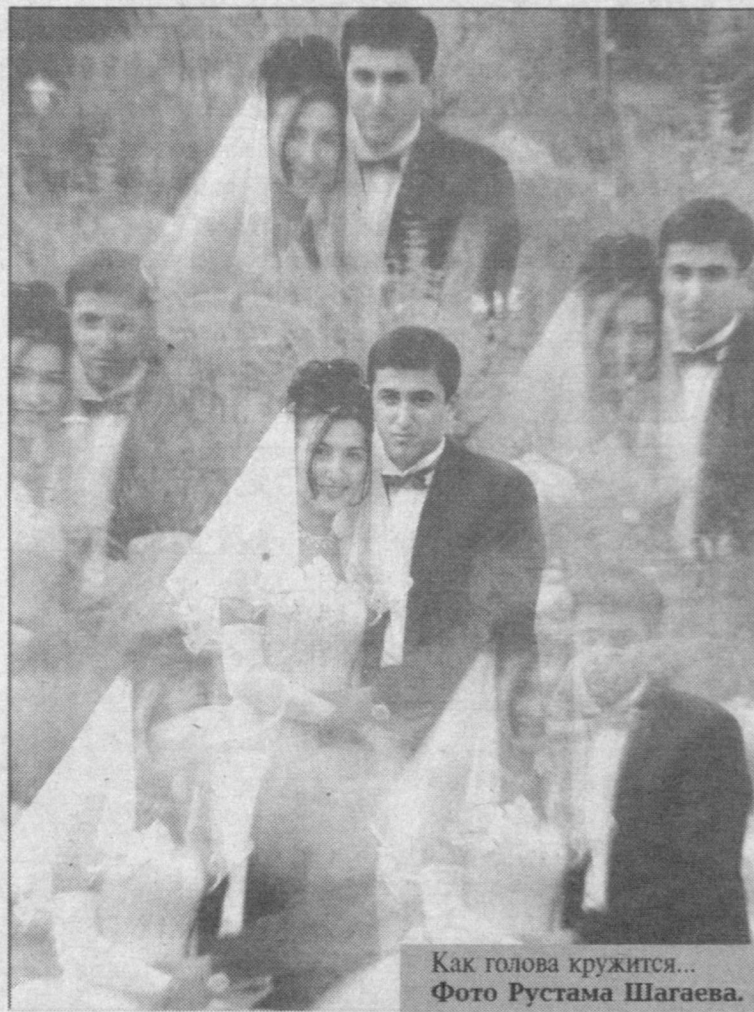
Как голова кружится...