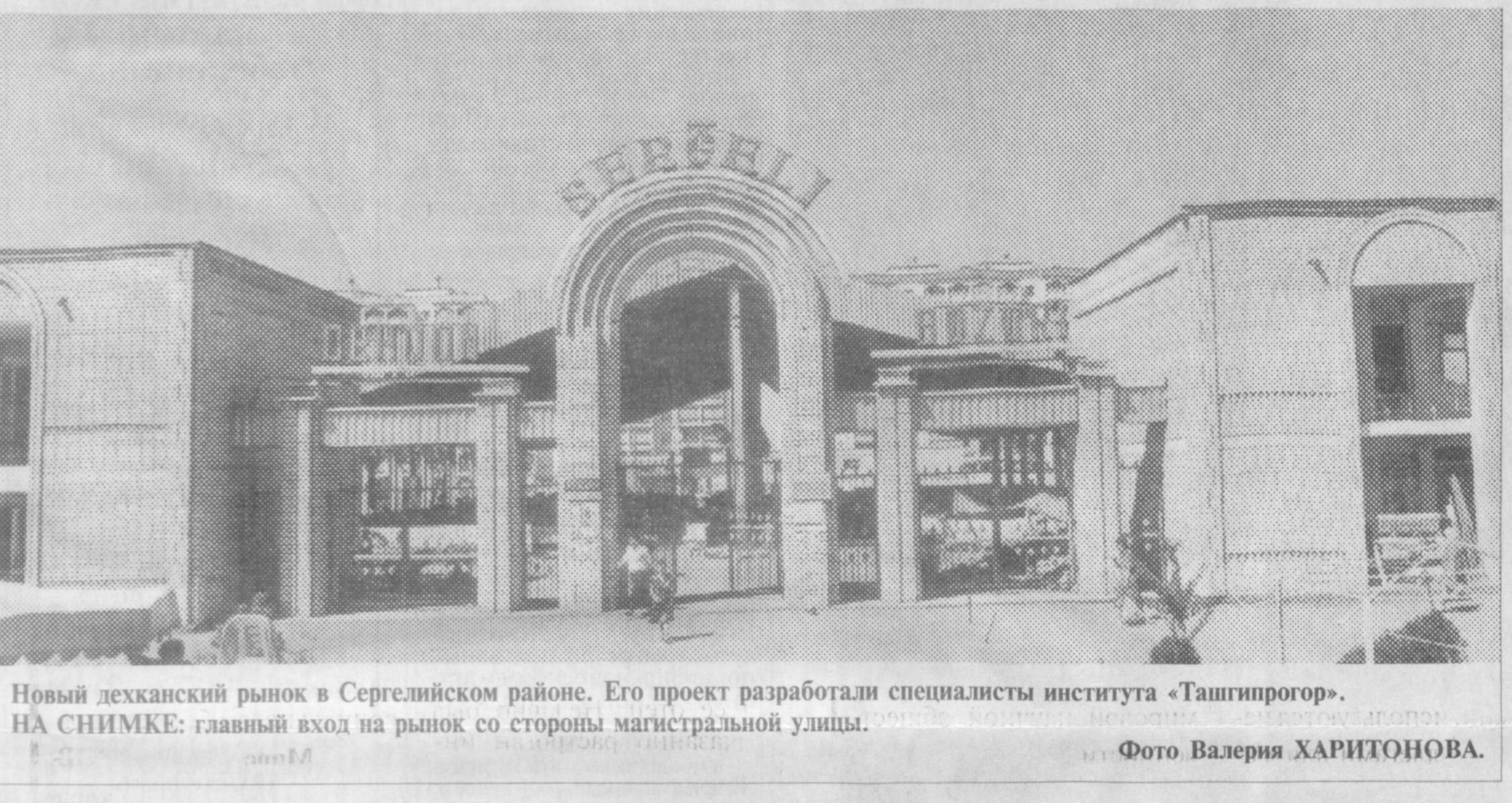
Новый дехканский рынок в Сергелийском районе. Его проект разработали специалисты института «Ташгипрогор». НА СНИМКЕ: главный вход на рынок со стороны магистральной улицы.