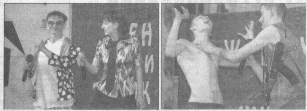
На улице температура была под сорок. Да и в самом Дворце культуры и техники Авиастроителей, где проходили четвертьфинальные игры КВН, благодаря выступлению восьми команд ощущалось не меньше тепло. По итогам игр двух дней определились лучшие шесть коллективов.

Поражает, с какой изобретательностью ребята моделируют современность, опираясь на старые фишки, демонстрируя вярные прежних кумиров. Тут и