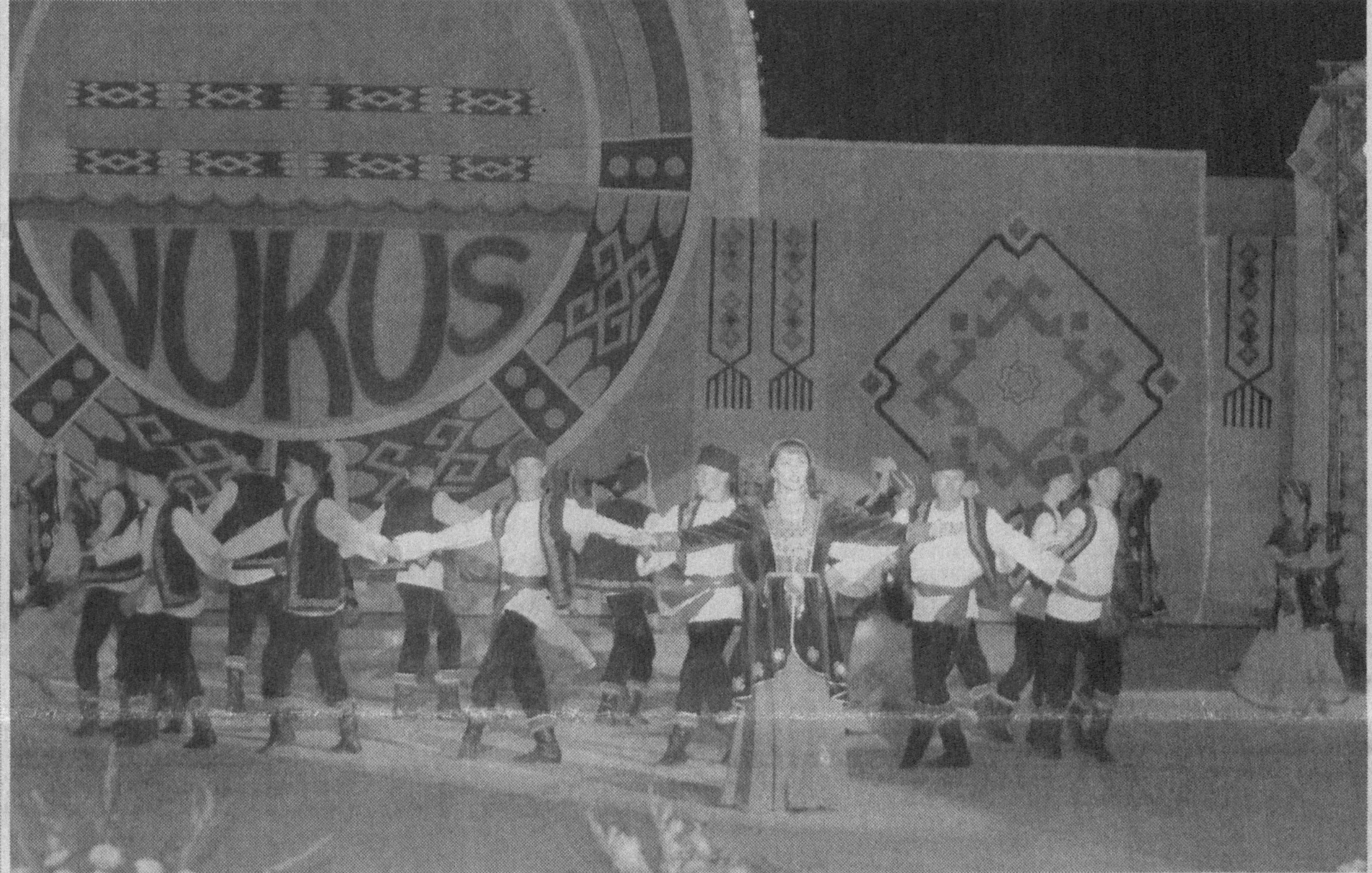
Юртбошимиз ўзининг таъриқ сўзида Нукус шаҳрининг бугун мамлакатимиз ижтимоий-маънавий ҳаётидаги ўрнига ургу берди, уни юртимизнинг шимолий дарвозаси, дея таърифлади. Дарҳақиқат, Ўзбекистонга Европа ва Осиёдан Устюрт орқали ташириб буюрган ҳар бир қарован ана шу шимолий дарвозамиз орқали ўтади. Мустақиллигимиз бозорлашга аниқ коммуникация тармоқларини вужудга келтириш, шимолий дарвозадан ўтадиган йўллари жаҳон андозаларига мослаб қайта қуриш юзасидан катта имкониятлар вужудга келди. Аввало, 345 чакиримлик Навоий — Учқудук — Нукус янги темир йўли тармоғининг қуриб фойдаланишига топширилиши муносабати билан шимолий дарвозамиз пойтахт ва бошқа вилоятларга тўридан-тўри боғлиқ, нисбатан яқинлашиб қолган бўлса, эндиликда бу йўлдан қўшни хорижий давлатлар ҳам фойдалана бошлади. Айни кунларда Устюрт чўлларида тезкорлик билан қурилаётган Европа — Осиё трансконтинентал йўли ва Андижон — Қўнғирот автобани шимолий дарвозамизнинг Шимоли Шарққа боғлашдаги аҳамиятини янада оширмоқда.

Президент Ислон КАРИМОВнинг Нукус шаҳрининг 70 йиллигига бағишланган тантанали маросимдаги сўзидан.