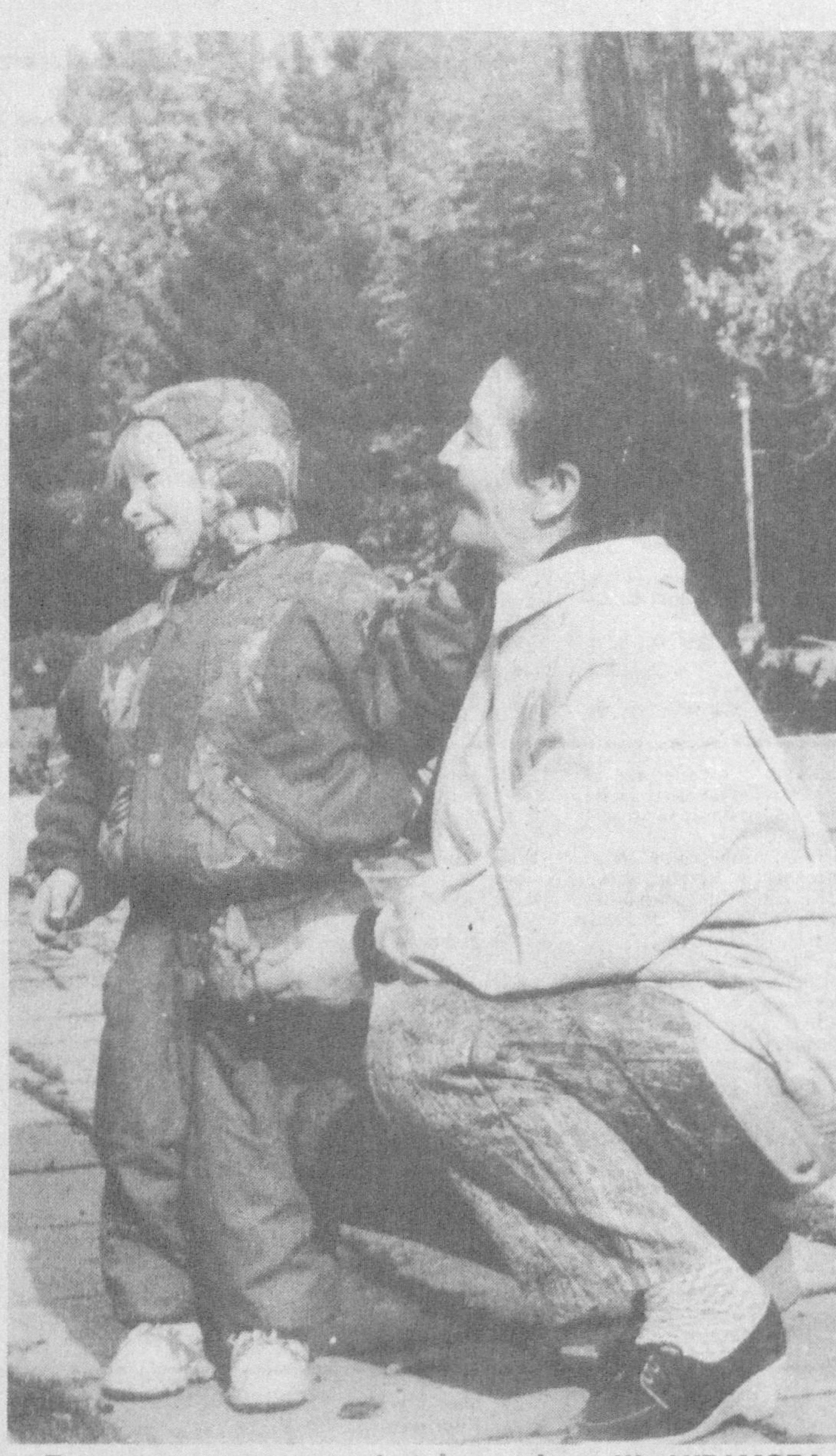
Будь счастливым, малыш!

Собные ребята, а некоторые по-настоящему талантливы. И, приобщаясь к искусству, они становятся духовно богаче. Когда, готовя репертуар, отдаем предпочтение классикам мировой драматургии, лучшим представителям современного театрального искусства, мы прежде всего думаем о воздействии на нравственность и духовность, о становлении личности подростка, формировании у них жизненной позиции. В переполненном зале, рассчитанном на 370 мест, на юбилейное представление собрались не только ученики почти всех школ района, но и их родители, представители Министерства народного образования, районного хокимията. Зрители увидели отрывки из лучших постановок школьного театра. А закончился праздник веселым «капустником». Александр АРИСТОВ