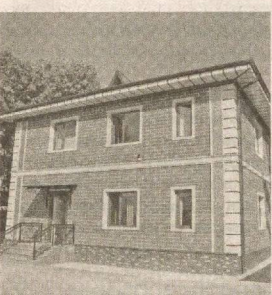
Вилоят ҳўкимлигининг қўмаги билан Андижон миллий ҳўнармандчилик ва ижтимоий иқтисодиёт касб-ҳўнар коллежининг бўш турган биноси реконструкция қилиниб,

Мамлакатимиз мустақиллигининг 27 йиллик байрами арафасида Андижон шаҳрида «Zahiriddin Muhammad Bobur Universal Academy» номини олган хусусий умумтаълим мактаби иш бошлади.