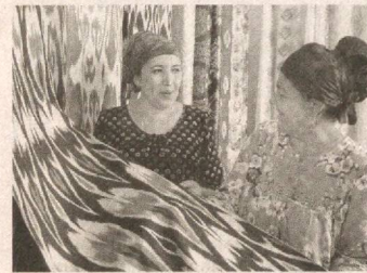
ҳам, маблағимизни ҳам тежаш имконияти яратилганидан хурсандимиз.

Туман деҳқон (озиқ-овқат) бозорида гўшт, сўт, туҳум ва бошқа озиқ-овқат маҳсулотлари билан савдо қилишга