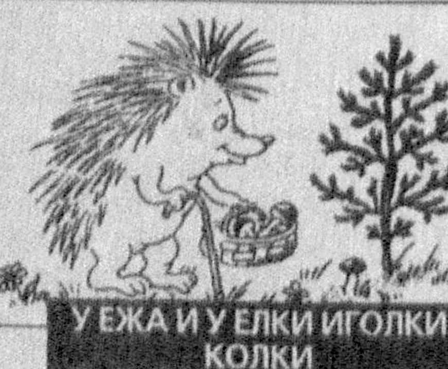
У БАЖИ И У ЛЯКИ ИГОЛКИ КОЛКИ

Сумеешь ли ты произнести их быстро и без запинки?