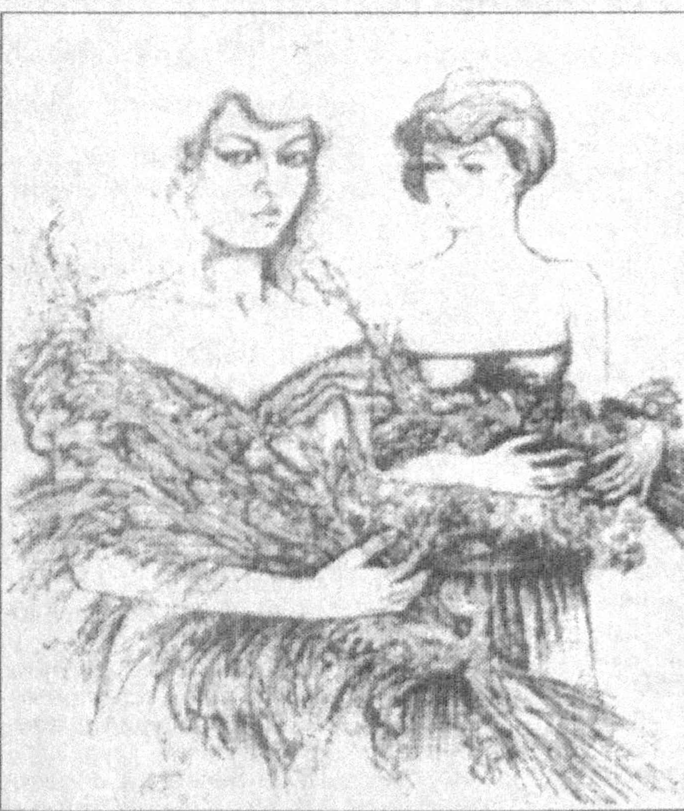
Эта Калидасы, жившего в V веке нашей эры: