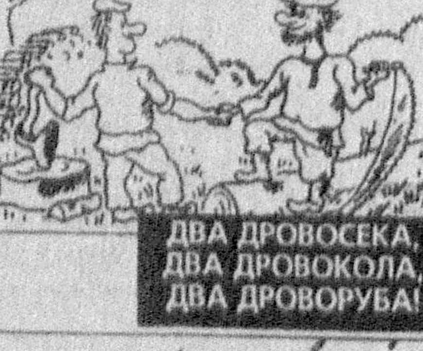
ДВА ДРОВОСЕКА, ДВА ДРОВОКОЛА, ДВА ДРОВОРУБА!