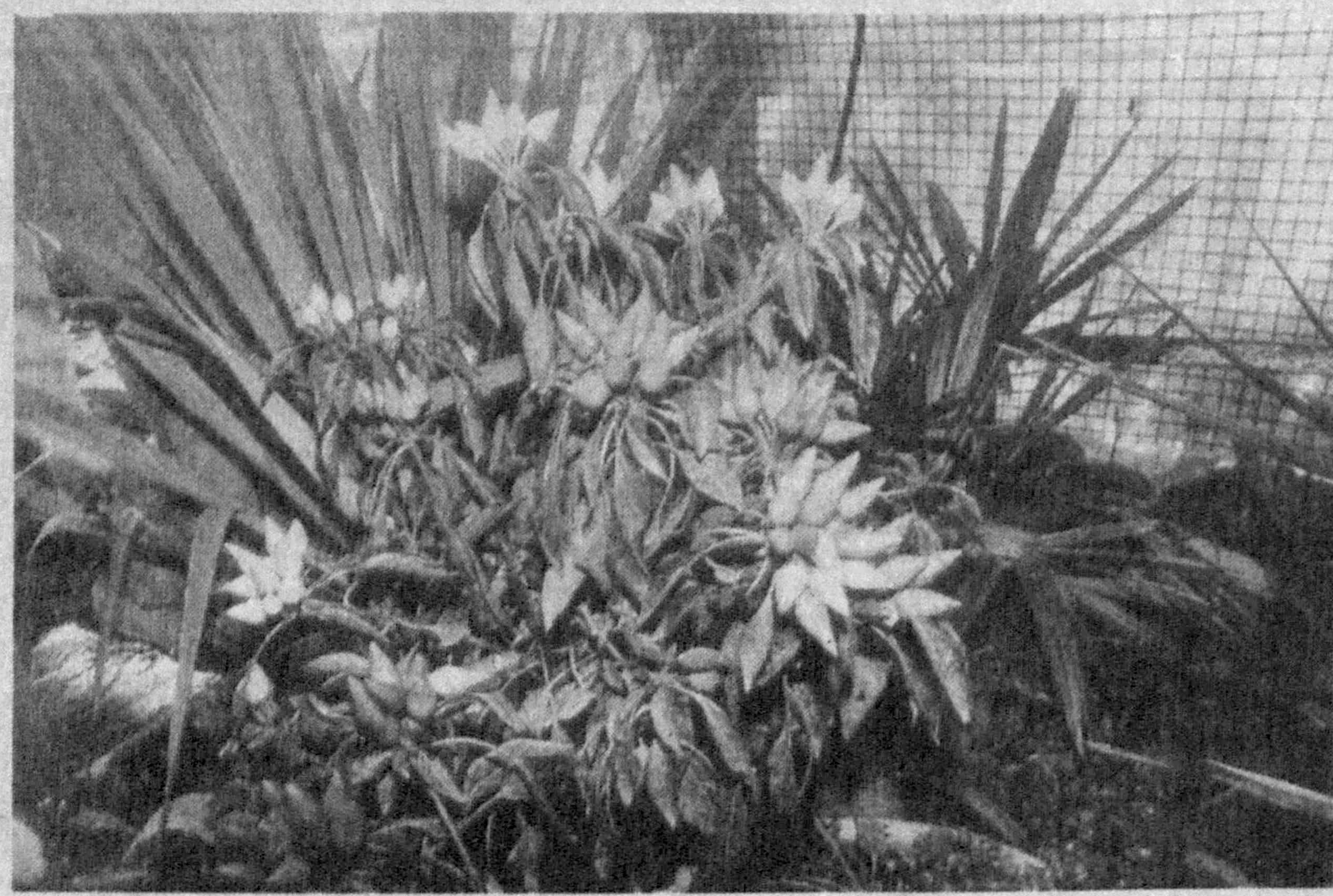
НА СНИМКАХ: Хужамберди и Ойдавалта Ходжаевы рассказывают внукам о «секретах» своего искусства; цветы, растущие в садовых горшках.

Африканская пальма, американская агава, цветы из Японии и Китая, других стран прижились здесь, словно на родной земле. Чудесные цветы охотно покупают городские организации, учреждения, граждане.