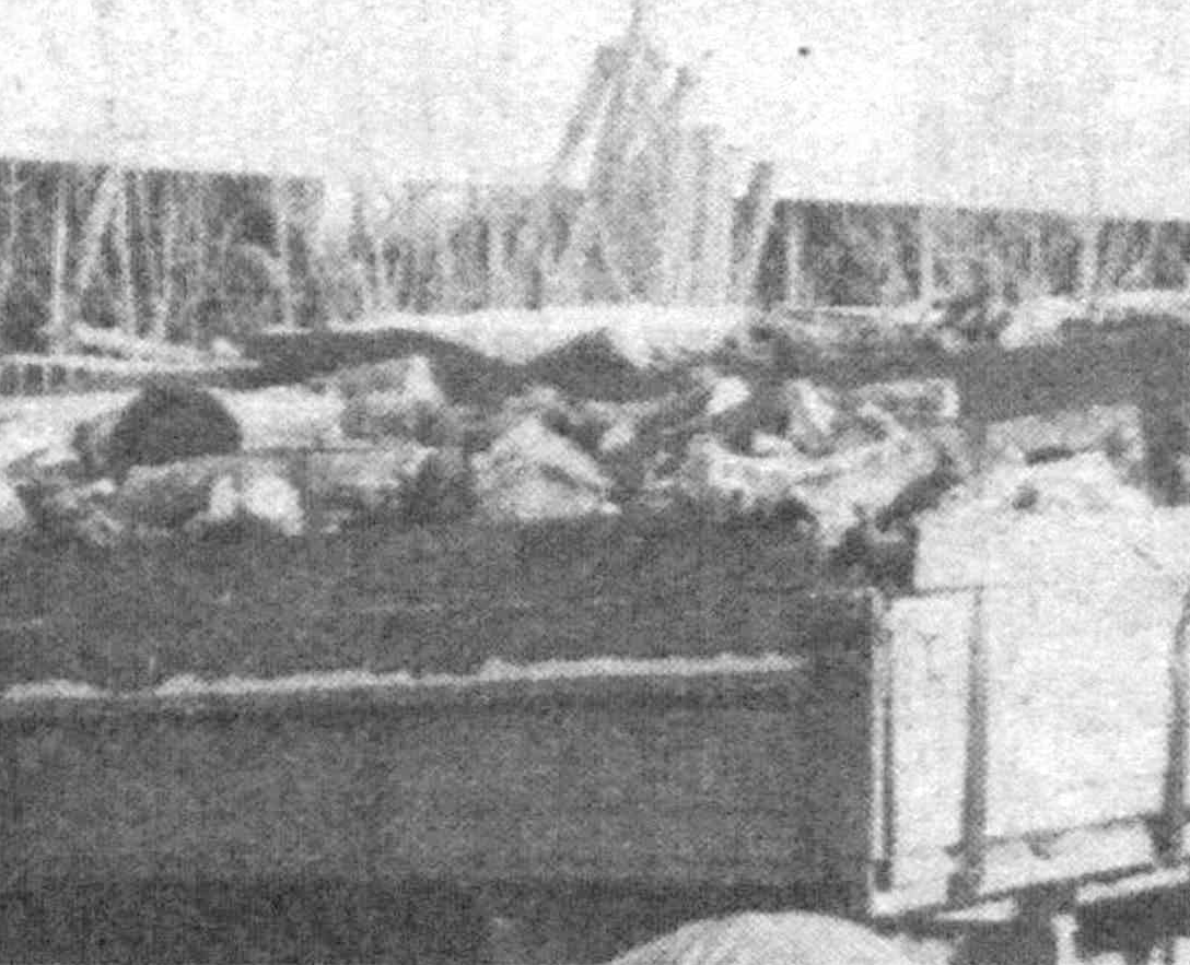
гражданина были оштрафованы.

Конечно, таких людей за самовольную вырубку наказывают. В прошлом году 42