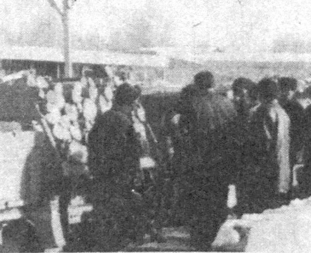
по существующему правилу деревья, срубленные в городе, необходимо сдавать на базу Управления материально-технического снабжения Ташгорхжимята...