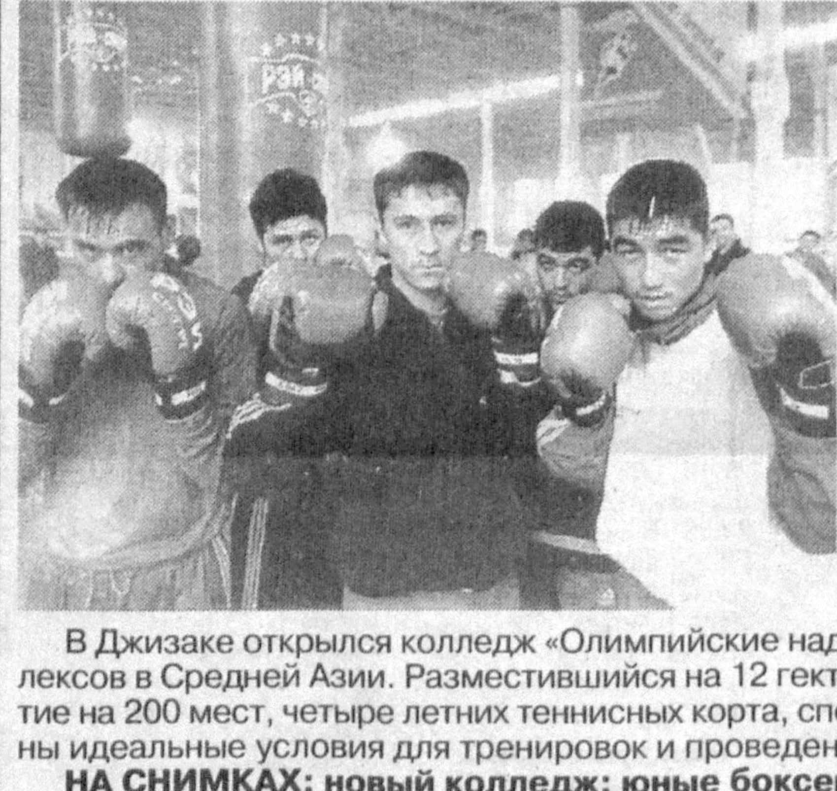
В Джизаке открылся колледж «Олимпийские надежды». Это один из крупнейших спортивных комплексов в Средней Азии. Размещившийся на 12 гектарах, он включает в себя учебный корпус, общежитие на 200 мест, четыре летних теннисных корта, спортивный зал, плавательный бассейн. Здесь созданы идеальные условия для тренировок и проведения соревнований по многим видам спорта.