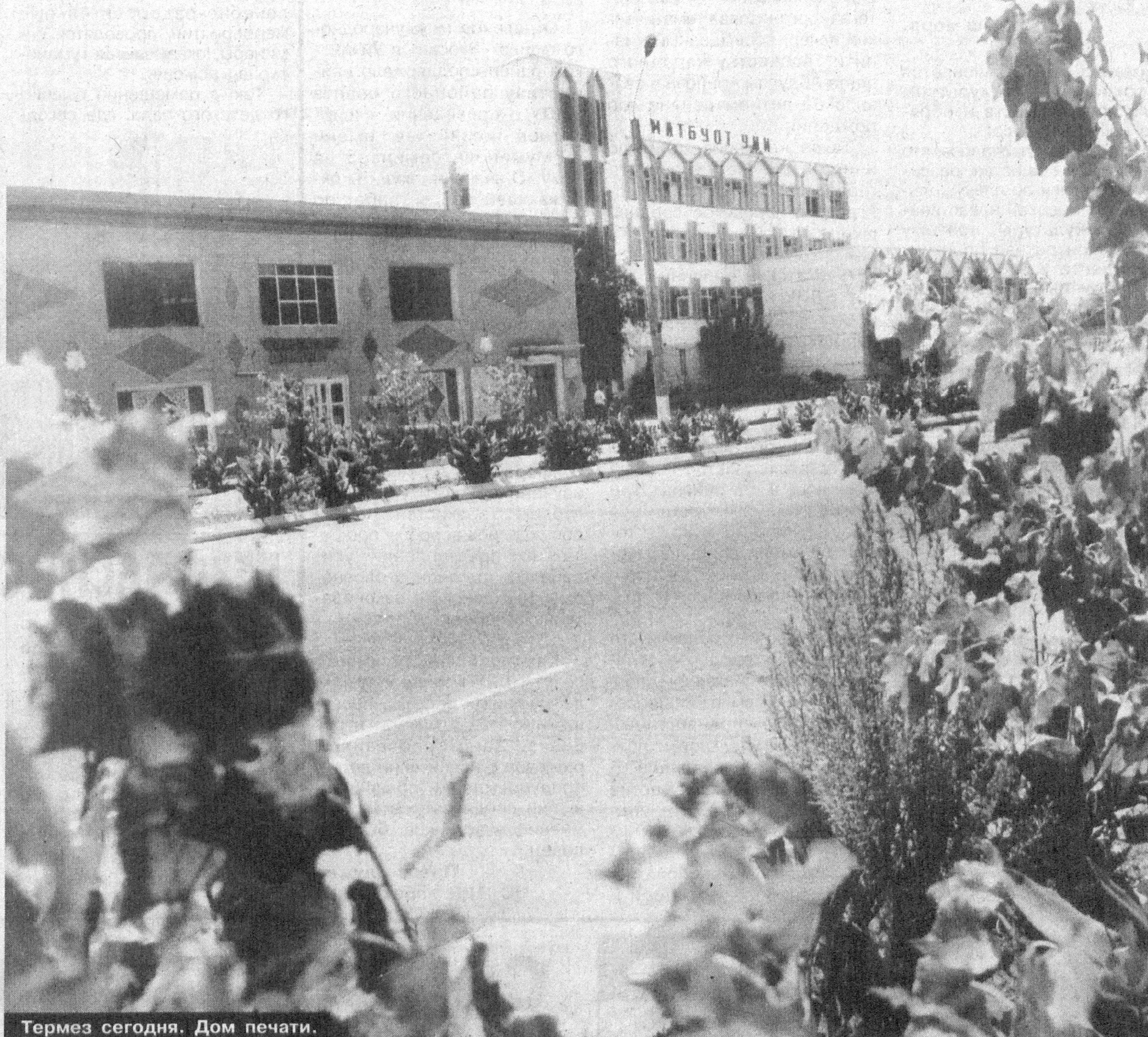
Термез сегодня. Дом печати.