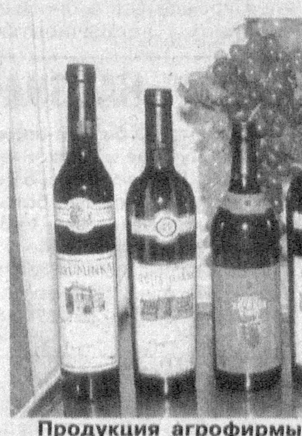
Продукция агрофирмы «Янгйуль»

Завод в Янгйульском районе располагает тремя собственными сырьевыми база-