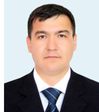
Тўлқин АБДУСАТТОРОВ, Адлия вазирлиги ҳузуридаги Интеллектуал мулк агентлиги директори

Миллий брендларнинг яратилиши, ихтироларнинг тижоратлашуви, илм-фан ривожига, мамлакатнинг иқтисодий тараққиётига, қолаверса, аҳоли турмуш даражасининг ошишига хизмат қилади. Шу боис, жамиятда илм-фан салоҳиятини юксалтириш, фан ва ишлаб чиқариш интеграциясини ҳамда интеллектуал мулк ҳимоясини таъминлаш муҳим аҳамиятга эга.