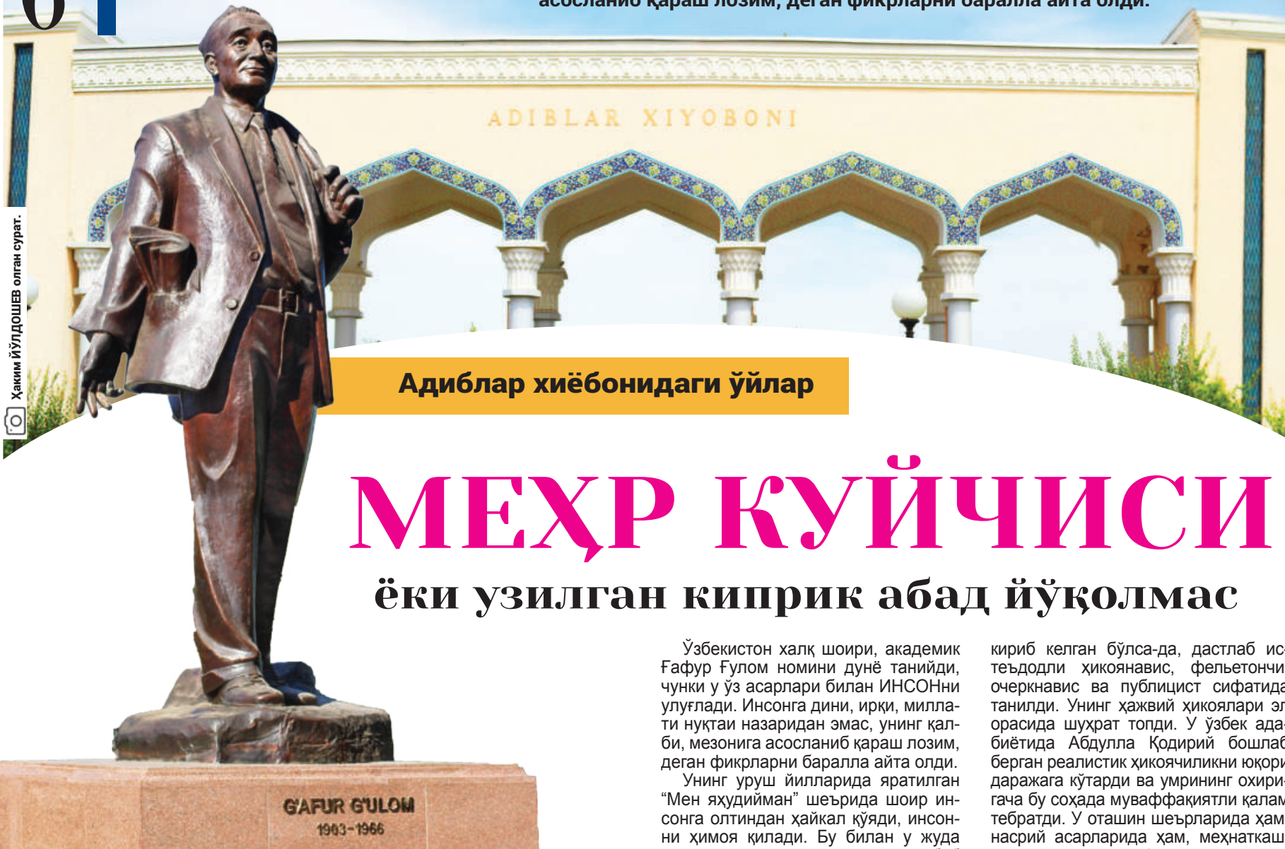
Адиблар хиёбонидаги ўйлар