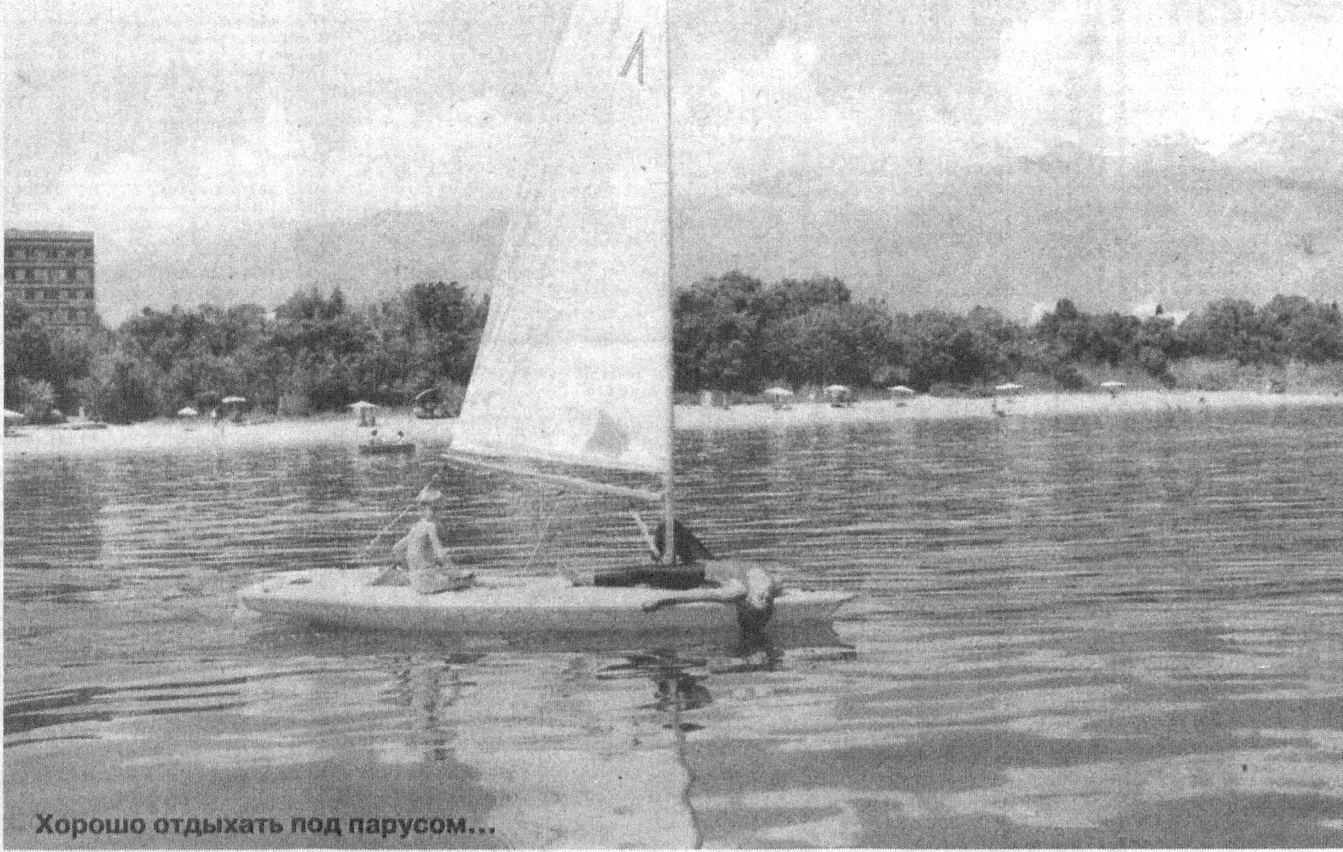
Хорошо отдыхать под парусом...

Однако шахматы в большей степени морально вознаграждают за успешное решение задач. Гораздо приятнее, к примеру, провести красивую комбинацию за доской, чем правильно предсказать дождливую погоду на предстоящую неделю.