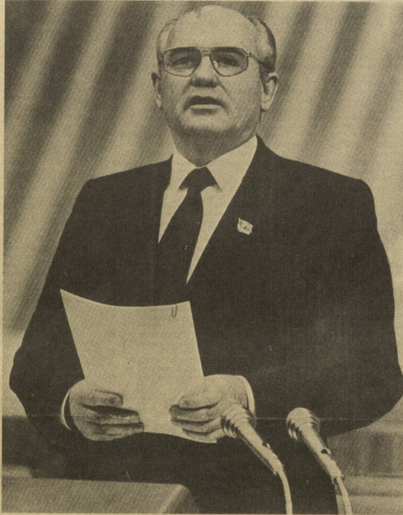
МОСКВА. Кремлевский Дворец съездов. 2 июля 1990 года. В зале заседаний XXVIII съезда КПСС; Генеральный секретарь ЦК КПСС М. С. Горбачев объявляет съезд открытым.