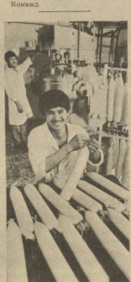
САМАРКАНД. Выпуск плавного колбасного сыра организован на Самаркандском молочном комбинате. Ежедневно в торговую сеть отправляется 150 килограммов.

В планах коллектива — смонтировать еще одну технологическую линию по выпуску пенополистирола, что позволит увеличить мощность цеха почти вдвое. (УзТАГ).