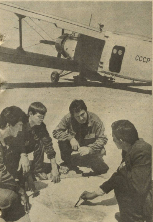
СУРХАНДАРЬИНСКАЯ ОБЛАСТЬ. Вторую подпорку риса ведут в совхозе «Правда» Гагаринского района. Работу выполняют пилоты Термезского авиапредприятия.

сти, возросшей политической активности масс. Идет работа по формированию и укреплению экономического механизма правового государства. Как и прежде, в своей внешней политике МНР проводит линию на установление дружественных связей со всеми государствами независимо от их политических, социально-экономических и идеологических различий на основе универсальных международных принципов укрепления мира, расширения сотрудничества, создания механизма безопасности, в особенности в Азиатско-Тихоокеанском регионе. Впереди — выборы в хуралы народных депутатов, которые состоятся в условиях реальной многопартийно-