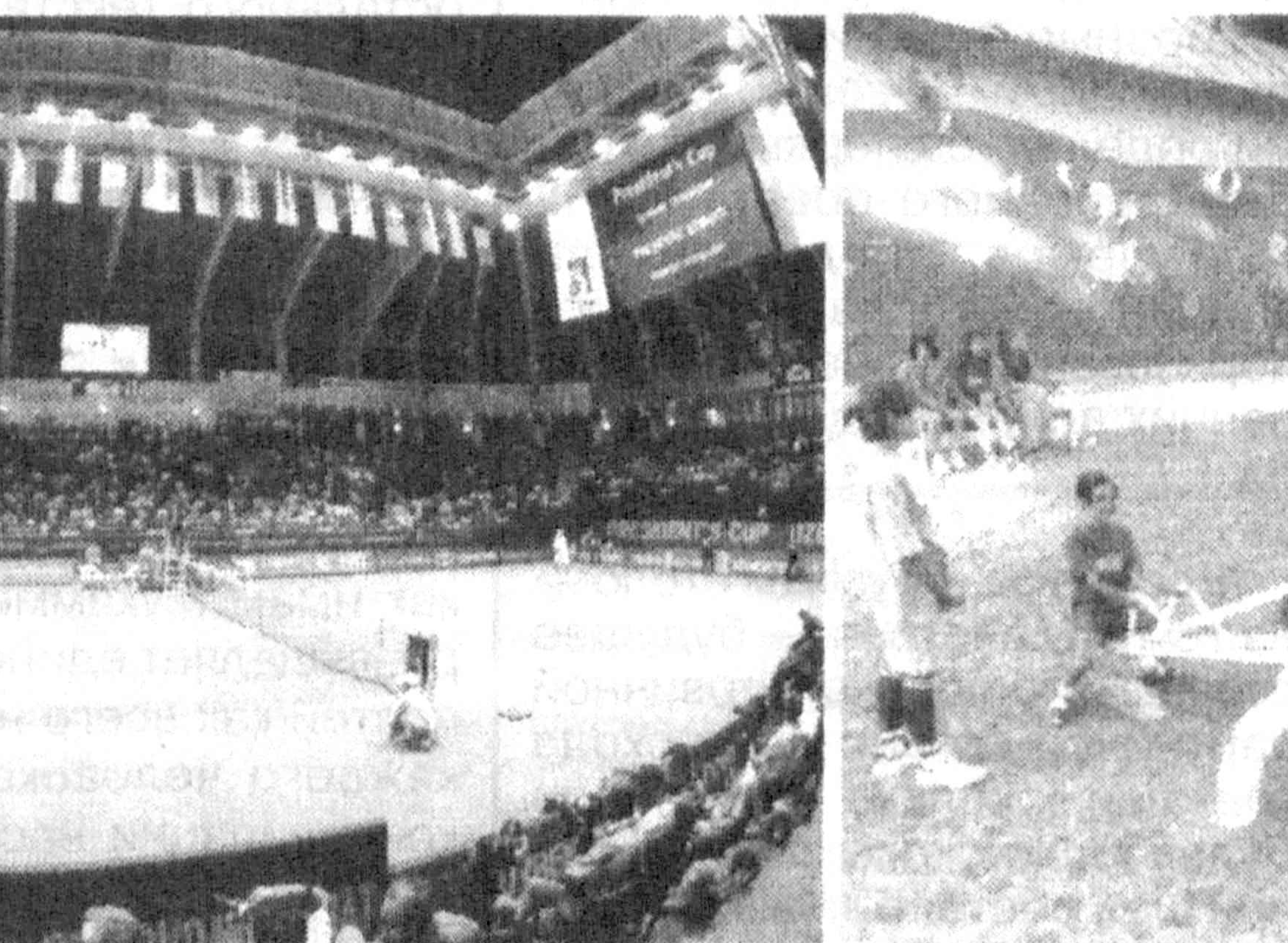
Любить и защищать Родину

Самым лучшим кабинетом по пропаганде и широкому изучению Конституции Республики Узбекистан членами комиссии Андижанского районного хокимията признан кабинет Куйганярского академического лицея. Он полностью оснащен современными техническими средствами обучения, здесь развернуты стенды с наглядными пособиями, книгами и брошюрами Президента Узбекистана Ислама Каримова, нормативными актами и сводами постановлений Кабинета Министров республики. Они помогают учащейся молодежи глубже знакомиться с Основным Законом страны, с проводимыми преобразованиями в политике, экономике, социальной жизни республики. Юноши и девушки занимаются под руководством опытных педагогов, юристов, которые дают подробные ответы на все интересующие их вопросы.