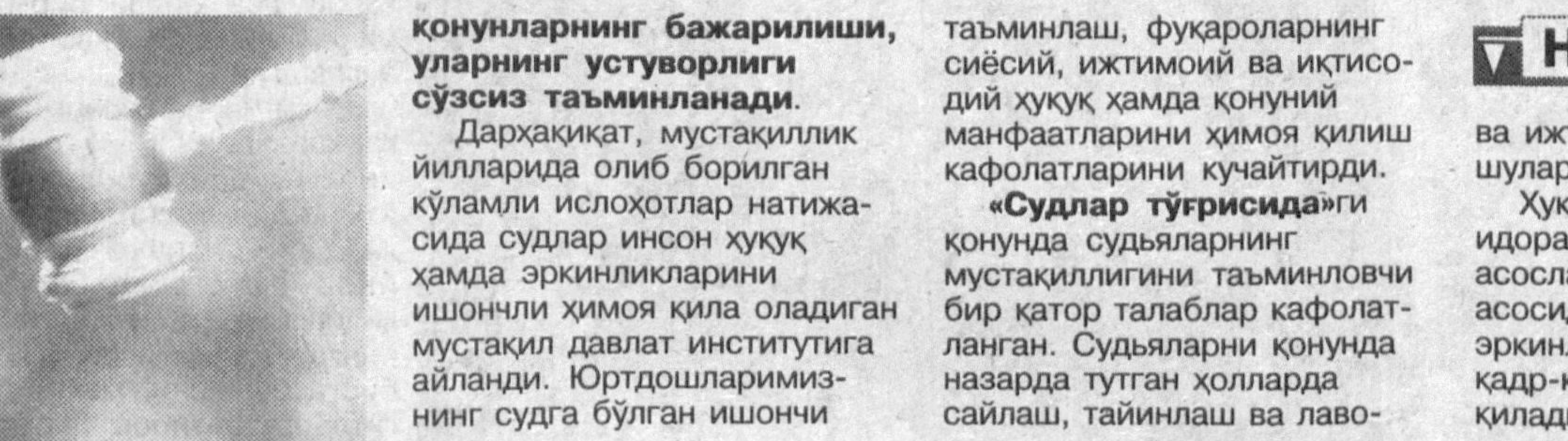
қонунларнинг бажарилиши, уларнинг устуворлиги сўзсиз таъминланади.