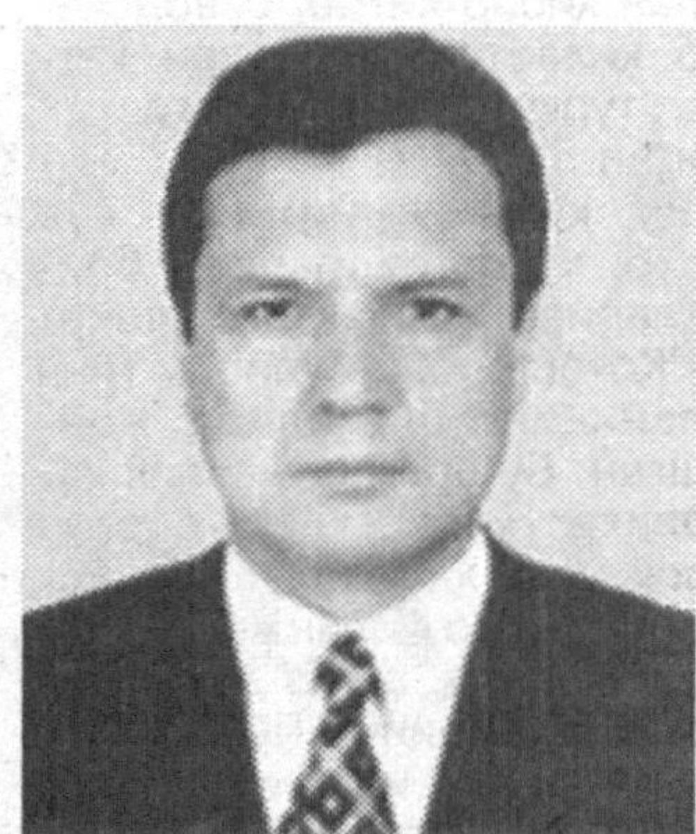
Нурдин ИСМОИЛОВ, Олий Мажлис Қонунчилик палатаси Қонунчилик ва суд-ҳуқуқ масалалари қўмитаси раиси: