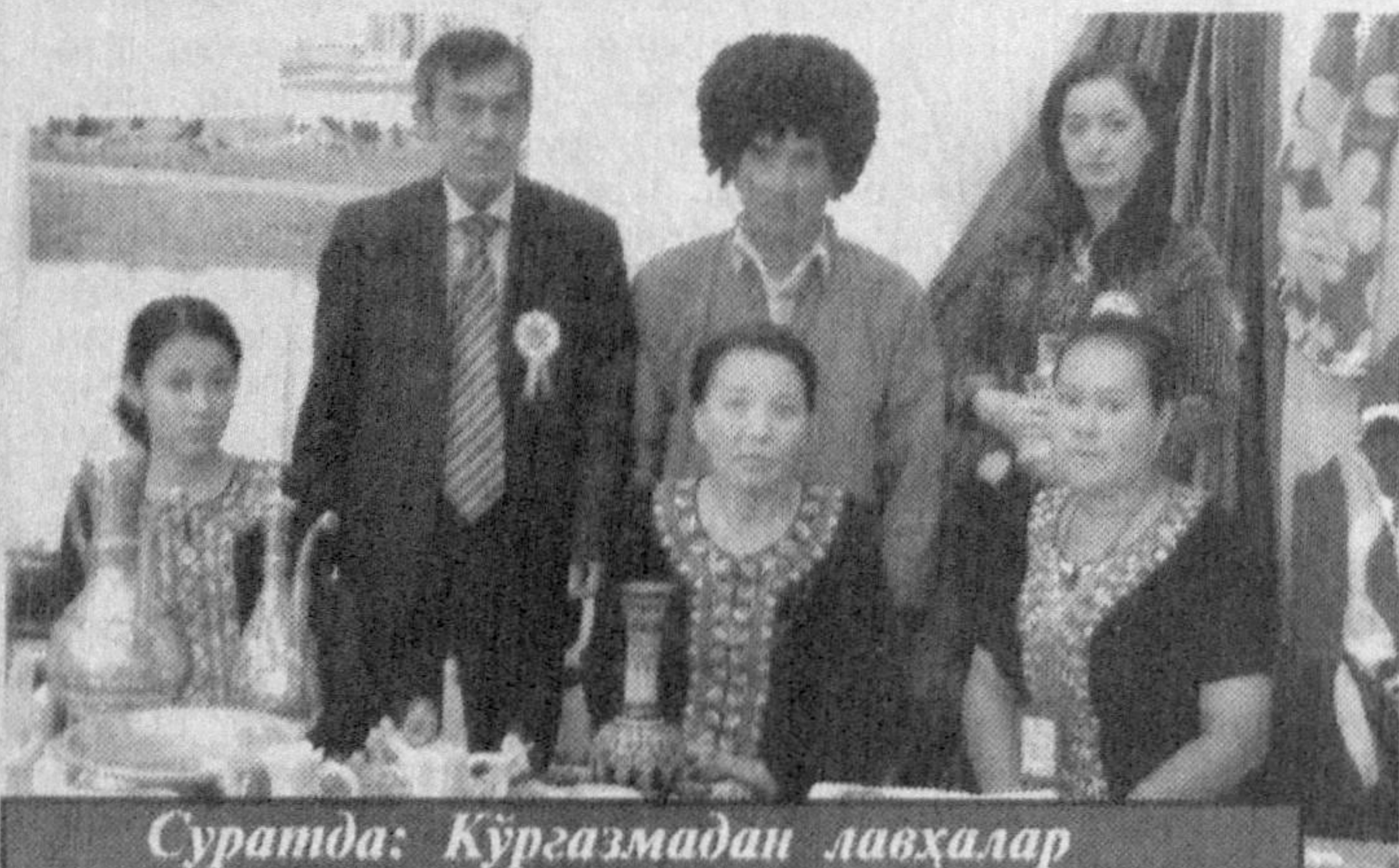
Суратда: Кўргазмадан лавҳалар

Ҳатдан юқори сифатга эгаллиги туркман дўстларимизни мамун этди. Умуман, биз намойиш қилган дарслик-қўлланмалар, кодекс ва мейёр-хуқуқий ҳужжатлар тўпламлари, плакат ва альбомлар ҳақида барча давлатлардан келган делегация аъзолари мактовли фикрлар билдиришди. Хусусан, туркманистонлик ҳамкабарларимиз бу наشرларнинг икки-уч тилилиги, улларда ўзбек, рус ва инглиз тилларида маъ-