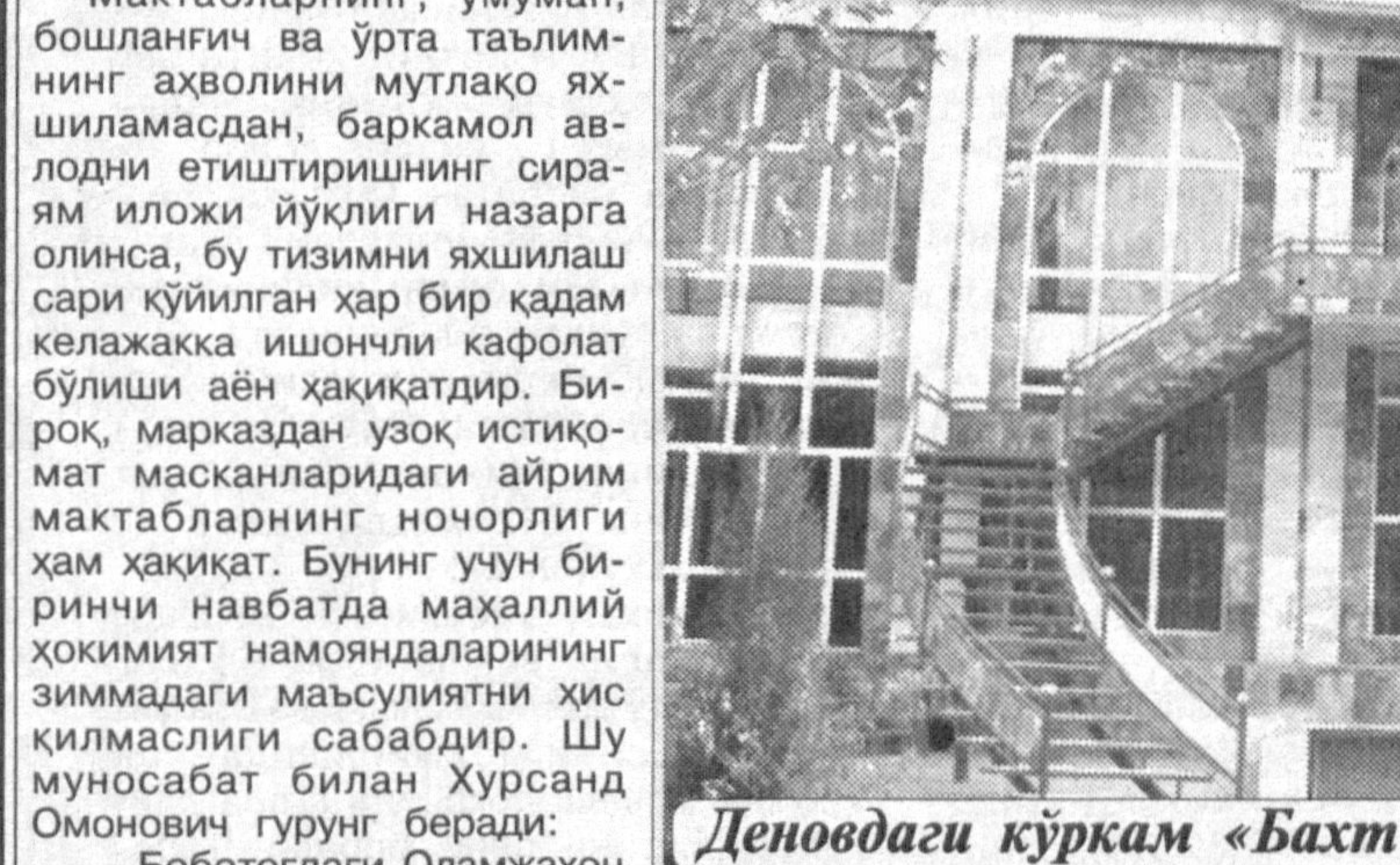
Деновдаги кўркам «Бахт уйи»