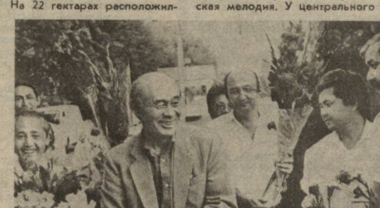
НА СНИМКЕ: встреча гостей, прибывших на Дни культуры Казахстана.

Дни культуры Казахской ССР начались в Узбекистане. Первые посланцы братской республики радушно встретил Ташкент. Чиназарский парк имени Улугбека пригласил сюда и представителей национально-культурных центров, чтобы они показали гостям свое творчество, изделия народных ремесел.