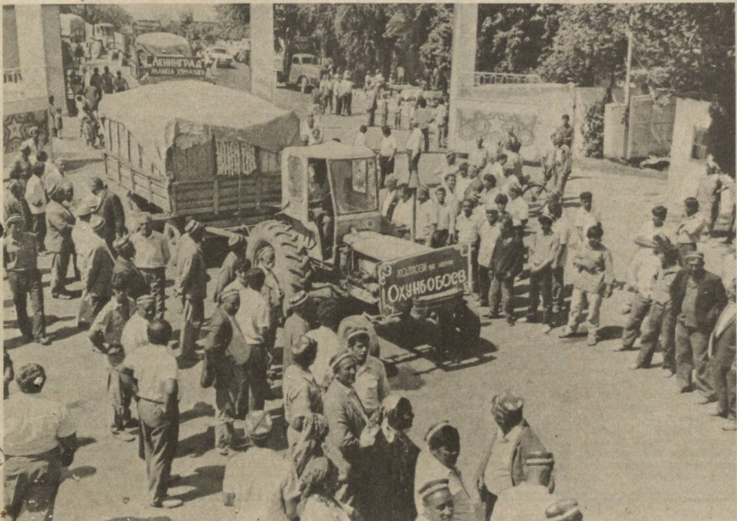
Радостно встретили на Узунском хлопкозаводе первый караван хлопков нового урожая, выращенного земля...