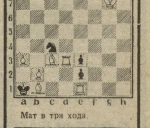
Мат в три хода.