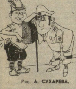
Рис. А. СУХАРЕВА.

Именно так проводится «тешкомотр» шарманки в западногерманском городе Бремене. Если владелец шарманки хочет получить разрешение на игру во время осенней ярмарки, он должен предъявить свой инструмент экспертам. Обычно в этой роли выступают полицейские инспекторы, обладающие абсолютным музыкальным слухом. И как бы ни была начислена и упрощена шарманка, достаточно одной фальшивой ноты, чтобы владелец не получил «текстолана».