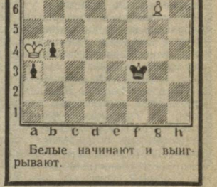
Ведь начинают и выигрывают.