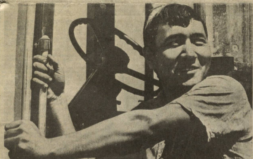
Первыми на поля совхоза имени Чуйкова Касанского района вывели хлопкоуборочные машины механизаторы отделения № 6. Под хлопчатником в совхозе занято 1.800 гектаров. Обязательство земледельцев в нынешнем году — сдать государству 3.300 тонн. Сейчас на полях работают 10 хлопкоубороч-

ных машин, ежедневно они собирают по 30 тонн хлопка.