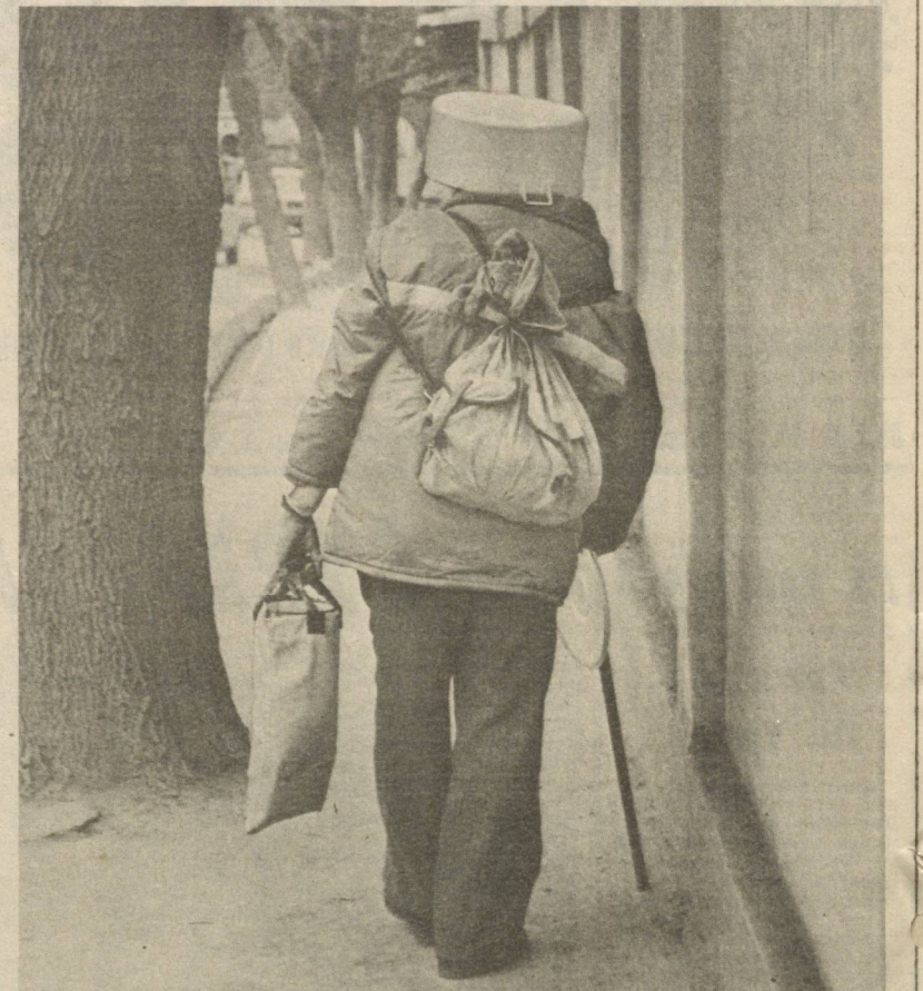
Путь к рынку!