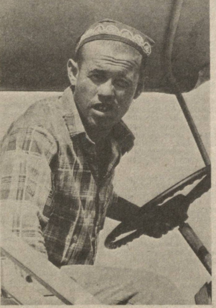
СУРХАНДАРЬИНСКАЯ ОБЛАСТЬ. Организовано ведение уборочной страды механизаторы совхоза имени 60-летия Октября Шерабадского района. С их помощью в хозяйства намечено собрать 85 процентов выращенного урожая. Вдохновляет капитанов «голубых кораблей» и нынешняя повышенная оплата. За каждую тонну бункерного сырца механизаторы получают по 10 рублей.