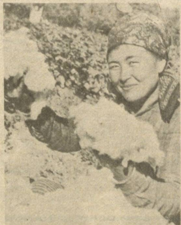
СТРАДА НА ПОЛЯХ

Дожди затормозили сбор хлопка. Раскисли поля, встала техника. Но, думаю, погодные дни еще будут, и уборочный конвейер заработает в полную силу.