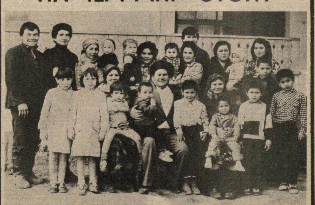
О жизни этой семьи читайте на 3-й странице.