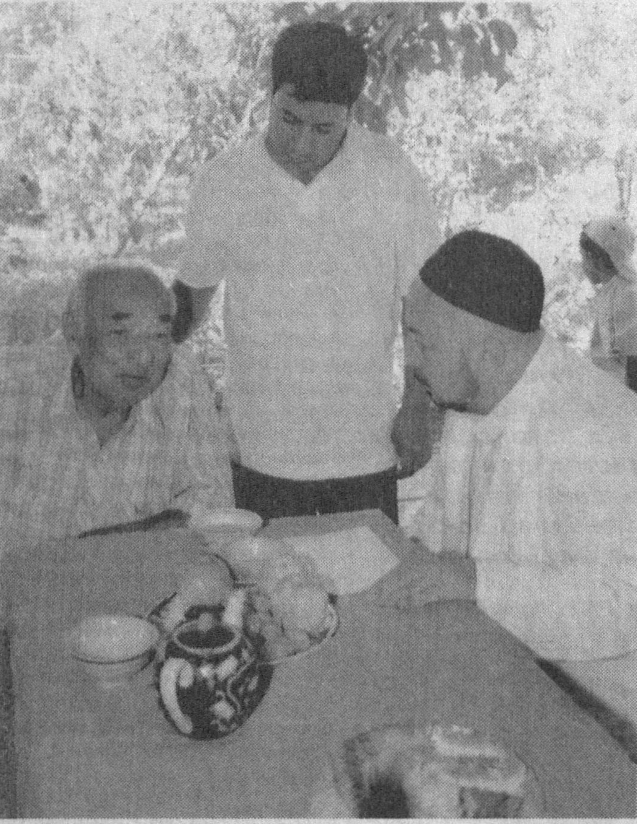
Алломонинг сўнги сурати. Бўстонлик, 2005 йил 14 август.

вафоти муносабати билан марҳумнинг оила аъзолари ва дўст-биродарларига чўқур ҳамдардик изхор этади.