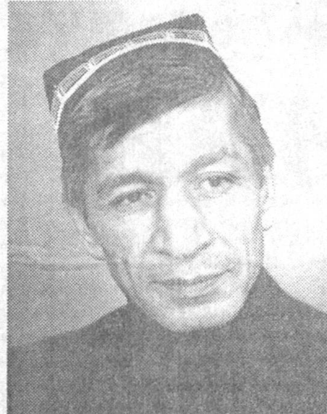
Анвар ОБИДЖОН, Ўзбекистон халқ шоири