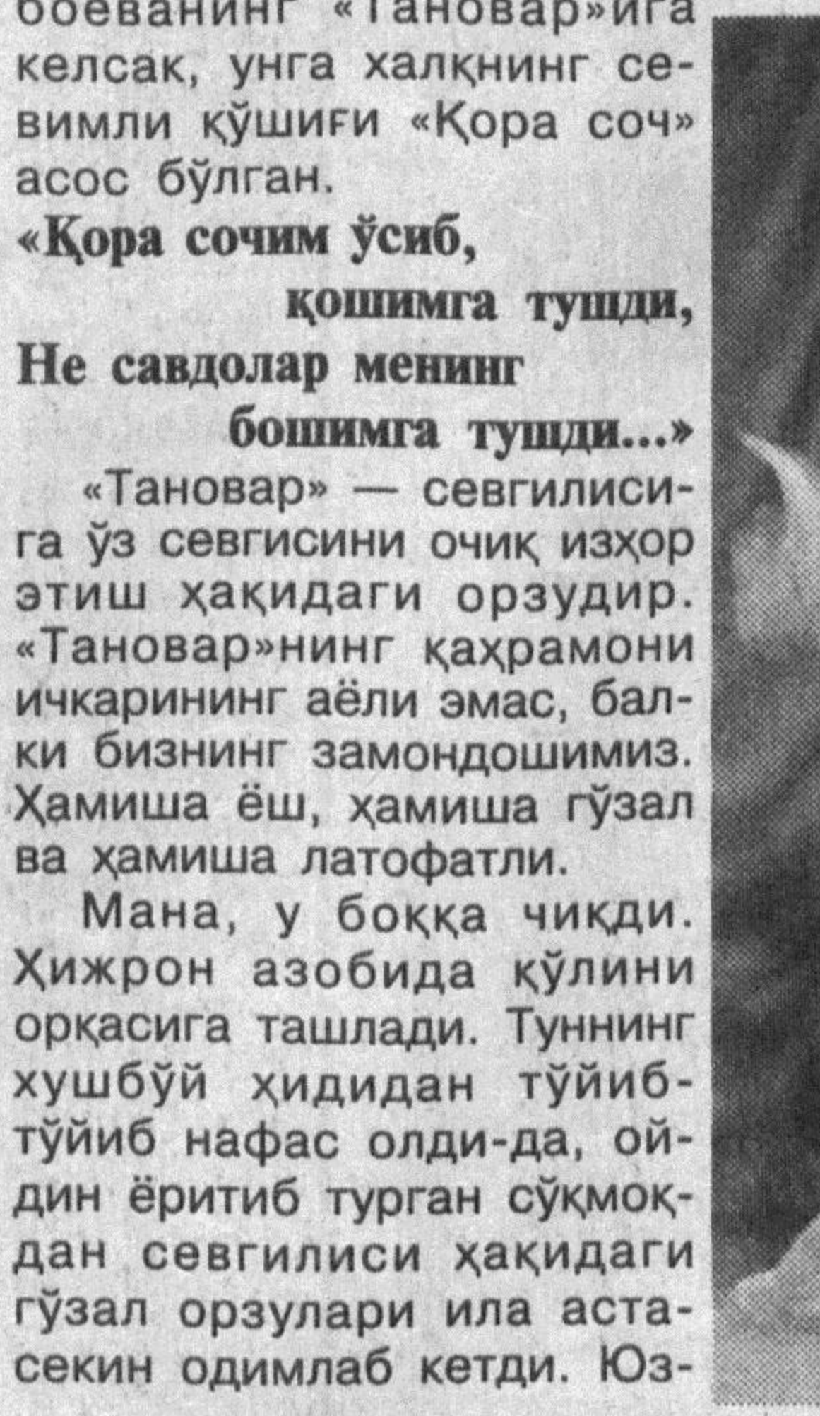
«Қора сочим ўсиб, қошмага тушди, Не савдолар менинг бошимга тушди...»

«Тановар» фақат рақс эмас, балки хореографик поэма ҳамдир! Аниқ манбаларга қарасак, Мукаррам опа 1943 йили саҳналаштирган «Тановар» дунё кезибди. Ўзбекини, ўзликни оламга танитибди. «Тановар»нинг ашула йўлидан яна бири Мўқимийнинг «Эмди сендек...»и билан айтади. Куй тузилиши жиҳатидан «Фарғонача жонон-2» ашуласига яқин. «Тановар»нинг «Гулбахор» куйи билан кетма-кет ижро этиладиган тури ҳам оммалашган. Барибир, Мукаррам Турғунбоевнинг «Тановар»ини тан оламан. Кўрган сари кўргим келаверади.