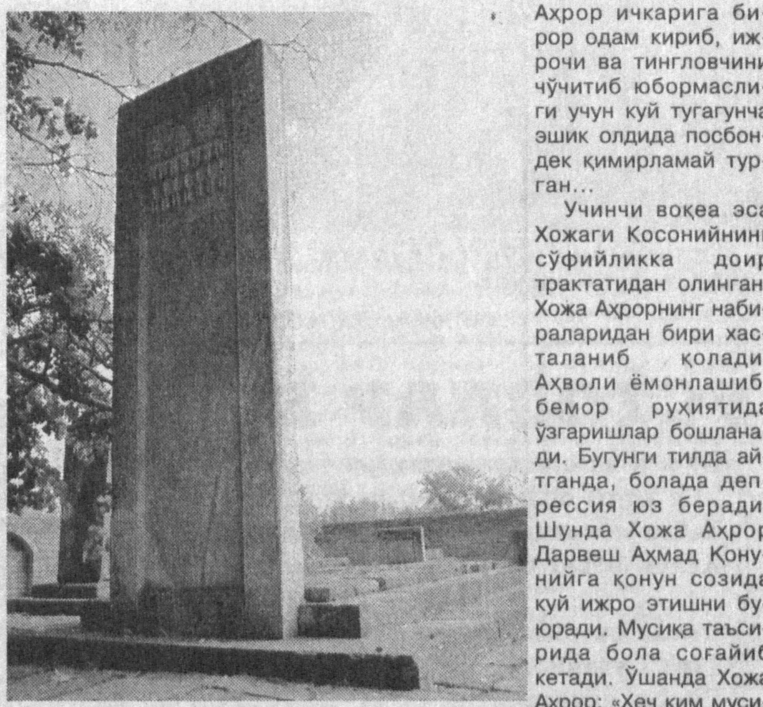
ҲОЖА АҲРОРНИНГ ҚОБИЛИДА ҚОЛДИ. УНИНГ ҚАБИРИ «ИККИ СУВ ОРАЛИГИДА», «СУВ ДАРВОЗАСИ» ДЕГАН ЖОЙДА, ДЕБ ҚАЙД ЭТИЛГАН МАНБАЛАРДА.

Шундай хикоятлардан бири Девонаи Ҳисомий билан боғлиқ бўлиб, туркий ва форсий тилларда икки девон яратган шоир мўаммо — шёрий топшимоқлар ҳақида ҳамда мусиқа илмига доир трактатлар ҳам ёзган. У сўз устаси сифатида шўрат қозонган, саёхатни яхши кўрган. Она шаҳри Хивадан кетиб, бирмунча муддат Қорақўлда яшаган Ҳисомий Самар қандга йўл олади. Ана шу ерда у илк бор Хожа Аҳрор билан учрашади. Шаҳарга кираришда у Хожи Мухаммад Дашти Қатағоний мақбараси олдида келиб жойлашиб олади ва рундан қотган нон олиб, бемалол ея бошлайди. Рамазон ойи бўлгани учун унинг бу ишдан гўзабланган одамлар атрофга тўпланиб, танбех берадилар. Ҳисомий ҳеч кимнинг гапига қулоқ солмай, нон ёйишда давом этади. Шунда Хожа Аҳрорни бу воқеадан хабардор қиладилар. Воквани эшитган Хожа Аҳрор, айтишлари-ча, отга ялангоёқ миниб, муқаддас даргоҳга елдек учиб келади. Муслмончилик таомилини бузган одамнинг аҳолига қараб, вазиятни тушунгач, мусофирга шундай савол беради: «Эй, гоғил банди, муслмонмисан?» «Алхамдулиллоҳ муслмонман», — дейди Ҳисомий. «Муслмончиликнинг неча фарзи бор?» — деб сўрайди Хожа Аҳрор. «Битта», — деб жавоб беради у. «Бу нима деганинг?» ҳайронликда сўрайди Хожа Аҳрор.