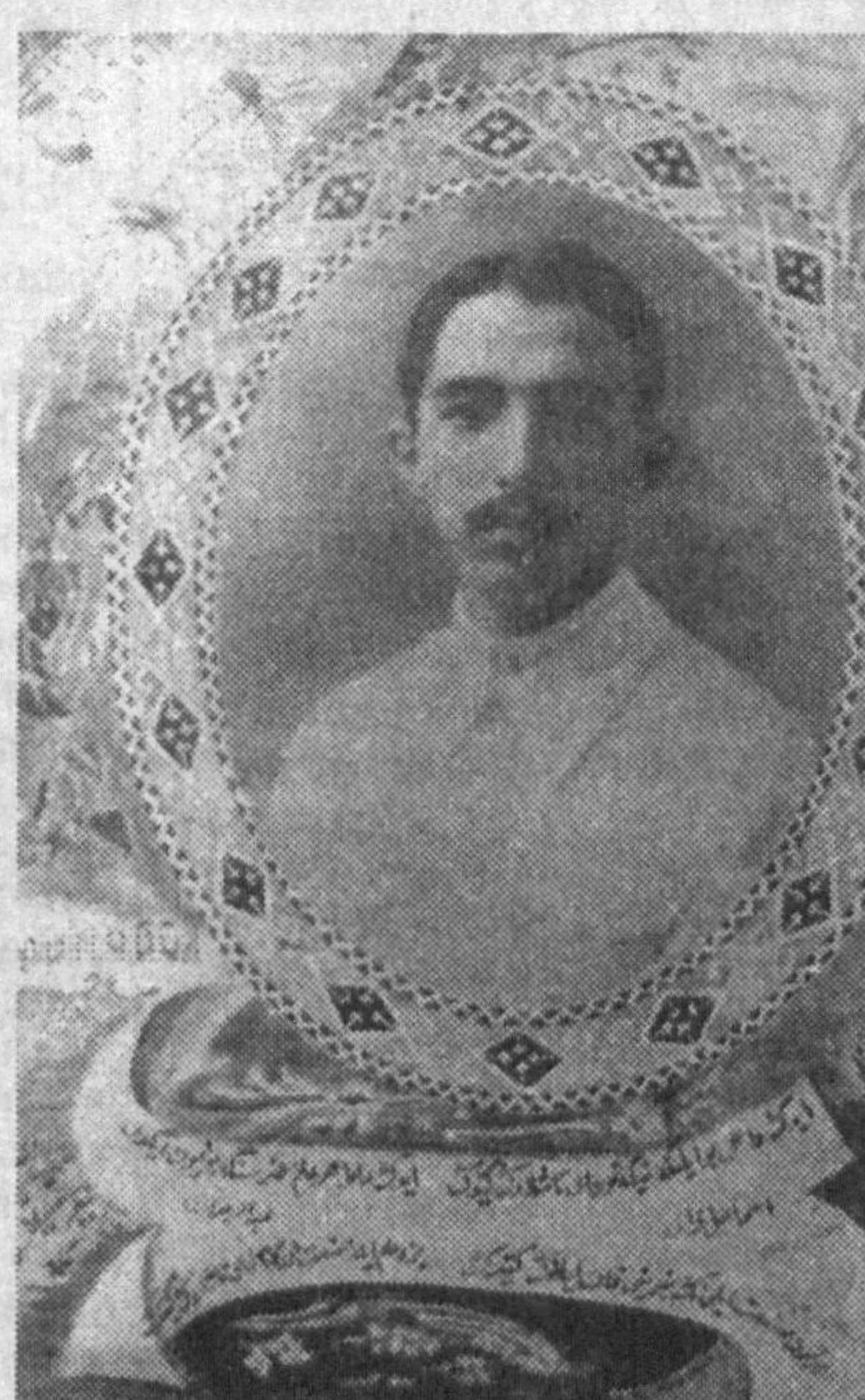
Исмоиловда ҳам ўзи директорлик қилган Ирфон мактабиде «Тараққий дарнаги» («Тараққий кўзуси») номига театр труппасини ташкил этган. Бунга ўша даврдаги газета эълонлари ҳам тасдиқлайди. Бу труппа кейинчалик «Тараққий» номи билан давлат труппасига айлантирилди ва Исмоиловнинг ўзи режиссёр этиб тайинланди.

...Октябр ўзгаришига дову Абдурахмон соатчилик хунари билан меҳнат қилиб турган бўлса ҳам инқилоб орқасида мактаблар очила бошлагандан кейин, барча ишларни ташлаб, ўзини муаллимлик қилишга бағишлаган эди. Бошда бир неча муаллимлик курсларида, ибтидоий мактабларда юриб расм ва кўл хунаридан дарс бериб турди. Кейин Ўрдада Ирфон мактаби очиб, шунда муаллимлик ва муаллимлик қила бошлади. Сўнги кунларда маориф шўбаси томонидан эски шухарда тузилган таълим-тарбия лабораториясига тайинланган эди, вафотида довуру шунда ишлади.