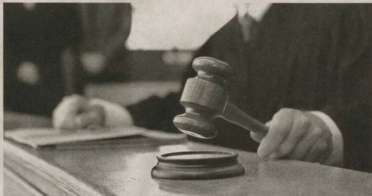
А Ж Р И М (Арифин ҳарфлари билан ёзилган)