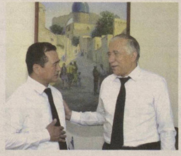
Саодатдан нигоҳ етмас адоқсиз йўллар ажратиб турганини билиб олиш мушкул эмас.

У дардкаши — онасини соғинса она, сингилларини кўмсаса меҳрибон сингил, кенг далаю даштларини соғинганда қиндик қони тўкилган замин бўлувчи қадрдонлари — қоғоз ва қаламга ёрилади, унсизгина дардлашади, кўнглини шеърга тўқади. Шунинг учун ҳам қатта ижодий тажриба соҳиби бўлган муаллиф шеърларида «соғинч», «болалик», «остона», «қолис», «нигоҳ», «сиҳрон», «армон» сингари сўзларнинг тез-тез такрорланиши ўқувчини зериктирмайди, балки шоирнинг дардини, ички кечинмаларини янада тугал илғашга кўмаклашади. Бу рўйхатга яна бир сўзни қўшиб лозим. Бу сўз — йўл. «Ўтли рух» китоби муаллифи «йўл фалсафасига» кучли соғинч туйғули мурожаат этаётганини, уни бахтдан, болаликка қайтишдек